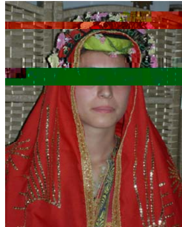
Şekil 22. Mudurnu ilçesi Gelin ba 1