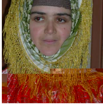
Şekil 6. Dörtdivan ilçesi kına gecesi başlığı