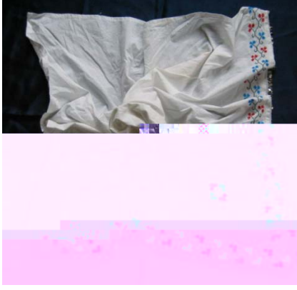
Şekil 15. Nakı lı yazmanın genel Görünümü