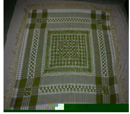
Şekil 5. Çember (ba örtüsü)