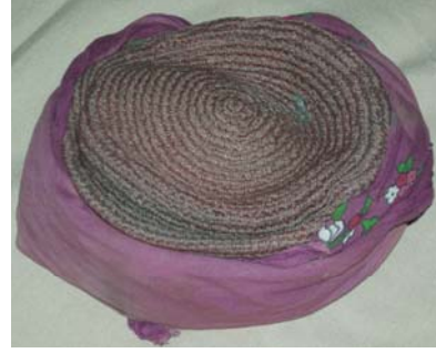
Şekil 3. Çeki'nin fes'e bağlanması

Çeki; Genellikle kırmızı rengin tercih edildiği çeki tülbent, yazma türünde kuma tan yapımı baş örtüsünün fes'in alın kısmına bağlanması ve uçlarının fesin içine saklanması ile kullanılan bir örtüdür. Çekinin üzerine sayısı maddi duruma bağlı olarak altın paralar takılmaktadır (Şekil 2,3).