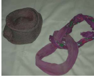
Şekil 2. Fes ve çeki