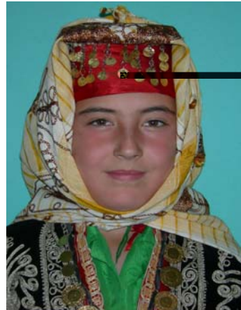
Şekil 14. Kıbrısçık İçesi Gelinba ı