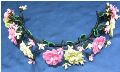
Şekil 21. Gelin tacı