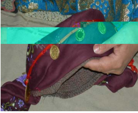
Şekil 4. Ba altınlarının fes'e yerleştirilmesi