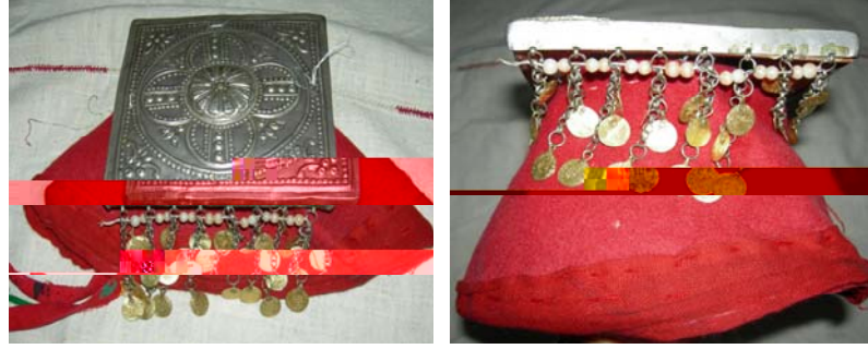
Şekil 10. Tepelik ve fes Şekil 11. Takka ve tepelik

Çeki: Kırmızı renkli olan al çekinin kullanım amacı fesi tutmaktır ve yörede çekiye “al çeki” de denmektedir. Genellikle ipekli kuma tan yapılmaktadır. Geçmişte yanlardan kâkül çıkarıldı 1, arkada ise çok örgülü saçlar oldu u söylenmektedir. Çeki, ipekli veya pamuklu el dokuması kuma tan yapılmaktadır. Çeki fes’in üzerine gelinler tarafından bağlanmaktadır. Fes’in ön kısmını kapatacak biçimde katlanarak iki ucu takkanın arkasından bağlanmaktadır ve böylece takkanın baştan dümesi engellenmektedir. Kıbrısçık’da kızlar “dallı çeki” adında etrafında çiçek olan çekileri takmaktadırlar ama çeki katlandı ı için çiçekleri görülmemektedir. Yörede gelinler kırmızı çeki kullanırken kızlar bordo renkli dallı çeki adında etrafında çiçek olan fakat katlandıklarında çiçekleri görülmeyen çekileri kullanmaktadırlar. Geçmişte gelinlerin düünlerinde başlarına örtülen ipekli saten kuma tan hazırlanan kırmızı tütekleri düünden sonra üçgen olarak ikiye bölerek, çeki olarak kullandıkları belirtilmektedir. Günümüzde üçgen formundaki çekiler kendi etrafında katlandıktan sonra önde alından, arka enseye kadar fesin etrafından dolandırılarak, arkadan çapraz olarak geçirilmekte ve önde çene altında bağlanmaktadır (Şekil 12).