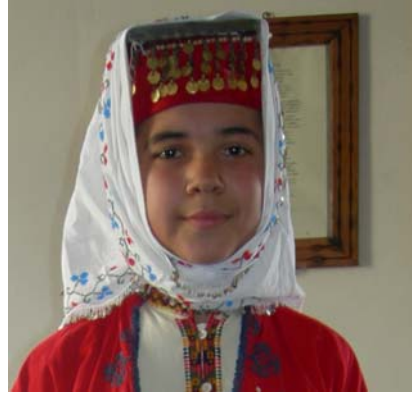
Şekil 16. Kıbrısçık İlçesi Geleneksel Kadın Ba lı ı