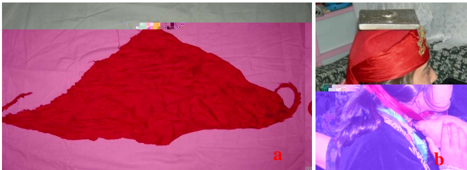
Şekil 12. Çeki'nin genel görünümü (a), çeki'nin kullanımı (b).

Çeki: Kırmızı renkli olan al çekinin kullanım amacı fesi tutmaktır ve yörede çekiye “al çeki” de denmektedir. Genellikle ipekli kuma tan yapılmaktadır. Geçmişte yanlardan kâkül çıkarıldı 1, arkada ise çok örgülü saçlar oldu u söylenmektedir. Çeki, ipekli veya pamuklu el dokuması kuma tan yapılmaktadır. Çeki fes’in üzerine gelinler tarafından bağlanmaktadır. Fes’in ön kısmını kapatacak biçimde katlanarak iki ucu takkanın arkasından bağlanmaktadır ve böylece takkanın baştan dümesi engellenmektedir. Kıbrısçık’da kızlar “dallı çeki” adında etrafında çiçek olan çekileri takmaktadırlar ama çeki katlandı ı için çiçekleri görülmemektedir. Yörede gelinler kırmızı çeki kullanırken kızlar bordo renkli dallı çeki adında etrafında çiçek olan fakat katlandıklarında çiçekleri görülmeyen çekileri kullanmaktadırlar. Geçmişte gelinlerin düünlerinde başlarına örtülen ipekli saten kuma tan hazırlanan kırmızı tütekleri düünden sonra üçgen olarak ikiye bölerek, çeki olarak kullandıkları belirtilmektedir. Günümüzde üçgen formundaki çekiler kendi etrafında katlandıktan sonra önde alından, arka enseye kadar fesin etrafından dolandırılarak, arkadan çapraz olarak geçirilmekte ve önde çene altında bağlanmaktadır (Şekil 12).