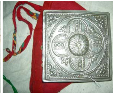
Şekil 9. Tepelik