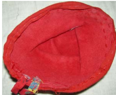
Şekil 8. Fes

Takka: Değerli motiflerde dövme olarak yapılan gümüş tepelikin fes üzerine dikilmesi ve çekinin fes etrafına başlanması baş giysisinin bütünüdür. Takka çuha fes üzerine dikdörtgen biçimde hazırlanmış gümüş tepelik ve çekinin dikilmesi ile yapılmaktadır. Çeki oyasızdır ama oyalı olanları da bulunmaktadır. Kıbrısçık ilçesinde genç kızların ancak evlendikten sonra takka takabildikleri belirtilmektedir ( ekil 11).