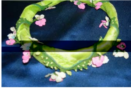
Şekil 19. Çeki