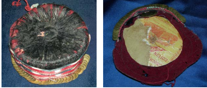
Şekil 18. Mudurnu ilçesinde kullanılan fes'in önden görünümü (a), fesin içi (b)

Gelin Tacı: ipek, ibri im vb. bükümlü ya da bükümsüz renkli ipliklerin, tı , firkete, mekik, i ne vb. araçların yardımıyla dü ümlenerek örüldü ü düz veya üç boyutlu süslemelere “oya” denmektedir (Sürür 1983, 11). ne oyalarda temel araç olarak i ne, yardımcı araç olarak tı ve firkete kullanılmakta ve ipek ya da pamuk ipli i ile yapılmaktadır. erit halinde hazırlanan i ne oyaları tel üzerine sarılarak taç ekline getirilmektedir. Mudurnu ilçesinde genç kızların ba larına bu i ne oyası ile yapılan ve “gül” adı verilen gelin tacı taktıkları, gelinlerin ise fes ve alın üzerine “gül taktıkları belirtilmektedir ( ekil 21).