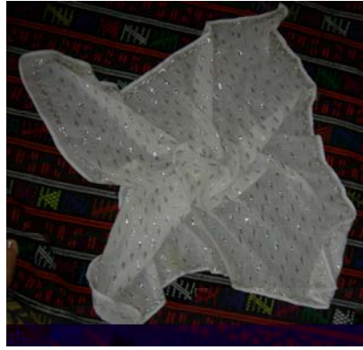
Şekil 17. Tel kırmanın genel görüntüsü