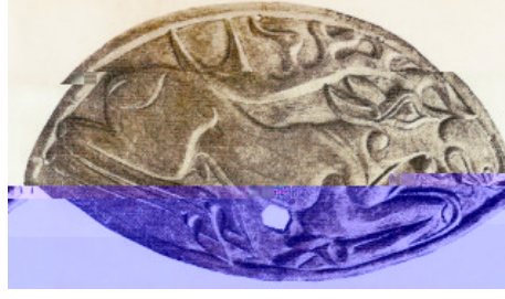
Resim-1: Frolov koleksiyonundan eyer kayısı süsü

özel bir önemi vardır. Hunların ve skitlerin özellikle geyiğe olan eylemleri yüzünden Avrasya bozkırlarında çeşitli malzemeden yapılmış tabiatçı görümlerle ya da üslupla mı sayısız geyik figürüne rastlanmıştır (Resim-1). Bugün bile Anadolu'da hala bir "geyik" efsanesi masalları süslemeye devam etmektedir (Diyarbakirli, 1999).