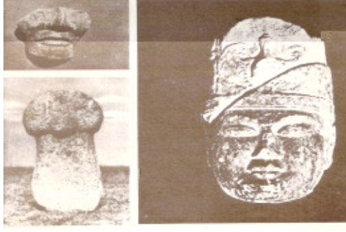
Resim-9 Kültigin'in Ba lı ve hanımına ait ba ve gövde

Bilge Ka an abidesinde de iki sıra halinde balballar batıdan doğuya uzanmaktadır. Ayrıca kaplumba a hariç hepsinin ba lı kopmuş dört erkek ve bir