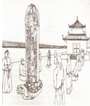
Resim-7: Kültigin Anıtının eması

amanist Türklerde ölümden sonraki hayat büyük önem ta ımaktadır. Bunu Hunlarda da görmü tük. Zira Hun kurganlarında bulunan e yalar ve cesetlere baktı ımız da bunu bariz bir ekilde görebiliriz. Hun asilzadeleri öldü ünde onunla birlikte en sevdi i kadını, ileri gelen subayları, köle ve hizmetçileri, halktan bazı ileri gelenler, kendini göstermi delikanlı cengaverleri, cins atları, silahları, günlük e yaları da mezara koyuyorlardı. Bu mezarlarda bazen yüzlerce, binlerce at ya da insan olabiliyordu. Bu ölen ki inin itibarına göre de i mekteydi.