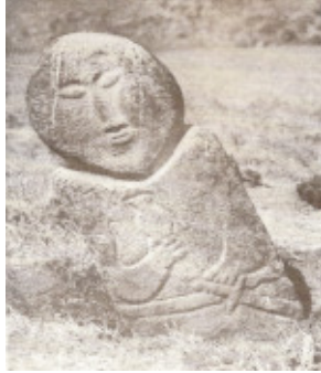
Resim-: Bir Balbal

Kültigin anıtında, Kültigin ve hanımı yan yana oturur vaziyette canlandırılmı tır. Ancak heykellerin parçalanması sonucu birçok parçası kaybolmu tur. Ele geçenler arasında sıkıca kapanmı dudaklar, enerjik bir çene ve yüz hatlarıyla kuvvetli bir ahsiyet gösteren Kültigin'in yüksek ba lıklı bir ba heykelinin ön kısmında kartal arması bulunmaktadır (Resim-9). Ba lık ve kanatları açık ku Türk gelene ine uygundur. Kartal Göktürklerde "kudret" in simgesidir. Kudret'se en güçlü olan Tanrı'yı ifade eder. Kültigin'in ba lı ındaki kartal motifini gücün, kudretin simgesi olması d ında daha önce gördü ümüz amanizm içindeki hayvan ana/ata kültürüne ba lı koruyucu ruh olarak da de erlendirebiliriz. Yukarı dünyanın tanrısı Ülgen'in yedi o lundan birisinin isminin de kartal oldu unu hatırlarsak buradaki kartal armasını amanizm'le ili kilendirmek kaçınılmaz olmaktadır.