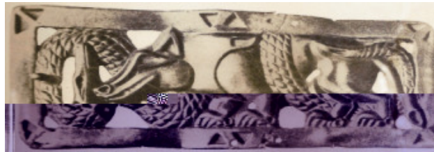
Resim-3: Kurt ve yılan mücadelesi, altın kemer tokası.

Bu yardımcı ruhlardan birisi olan "geyik"e ait figür, en eski dönemlerde Hiungnu'lara ait at koşum süslerinde, kılıç kabzalarında, kamçılarda, bele takılan sarkıntılı kemerlerin madenden yapılmış plaka ve tokalarında karşımıza çıkmaktadır (Resim-3). Ayrıca yine şamanlığın etkisiyle Ordos bölgesinde madenden birçok kemer süslemelerinde, hayvanlar hareketli gruplar ya da teker teker sakin halde görünür. Bunlar arasında hayvan mücadele sahnesi olarak isimlendirilen, yırtıcı hayvanın bir başka yırtıcıya saldırısını sık sık tekrarlanmıştır.