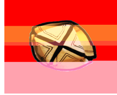
Kalpa ın Üstten Görünü ü