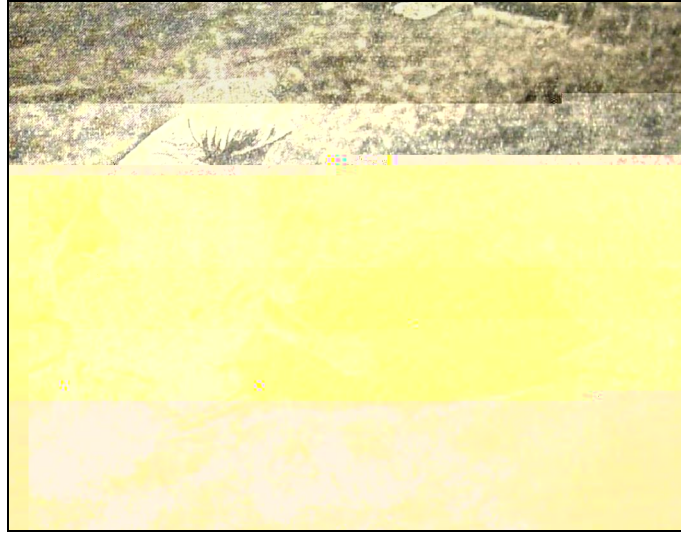
Resim 2: Deriye yoğurt sürülmesi (M. Aytbayev)

Tüydök adını alan yün yumakları son hâline veya ip hâline getirilmesi için en son iyikke saluu veya iyirüü işlemine baş vurulurdu. Bu işlemin yapımında iyik 11 adını alan bir alet kullanılır, bu alet yardımı ile ip yapımı işi tam olarak gerçekleştirilirdi. Bu işlemde tüydok olan gevşek ipin bir ucu iyik aletinin beden kısmı olan sapa bağlanır, sol elle ipin bir tarafı yukarıda tutulur ve sağ el ile de iyik aleti bacağın üst kısmına sürülerek kendi etrafında döndürülürdü. Döndükçe de gevşek olan ip sıkılarak ip hâline dönüşürdü. (Resim 1) 12 Bu işlemin sonunda artık ip yapımı tamamlanmış olur ve gerektiğinde bu ipten ihtiyaç duyulan eşyalar yapılırdı.