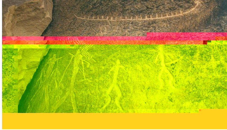
Şekil 6 Azerbaycan- Bakü'de Gobustan'daki kaya resimlerinden- Somuncuoğlu, 2008, 442.