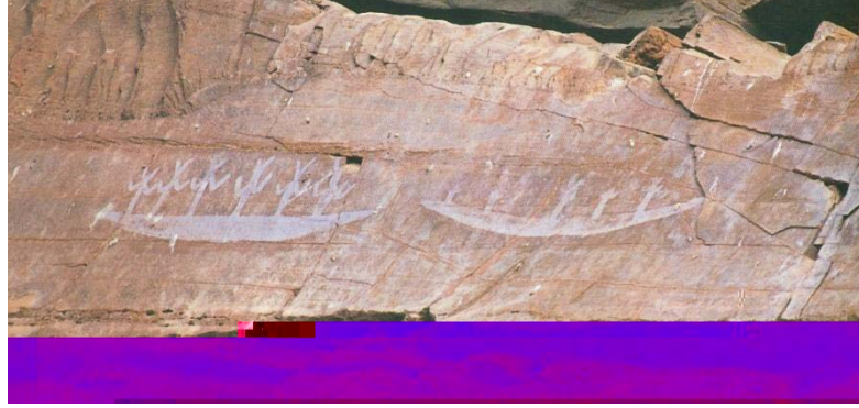
Şekil 5 Lena Nehri Kıyısındaki kaya üzerindeki resimlerin ayrıntıları- Somuncuoğlu, 2008, 40.