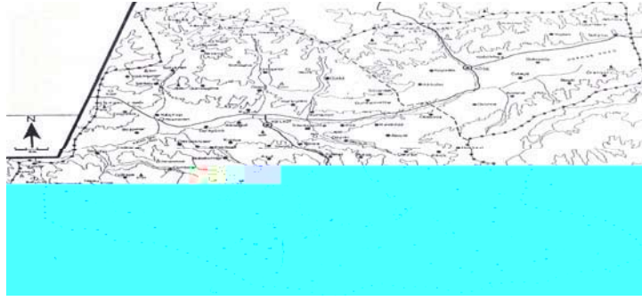
Ek 4: Kelkit İlçesi Yerleşme Haritası (Mormuş Düzü), Akpınar, K - m I I eK e eK e s.211