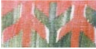
( arakeçililerin damgası 16