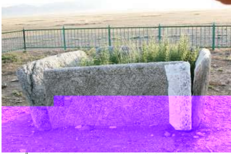
Üzerinde Türk kültür ve uygarlığına ait damgalar bulunan sunak masasının doğu cephesi

Moğolistan coğrafyasında yer alan Türk kültür ve uygarlığına ait eserlerin tamamına yakının üzerinde eserin ait olduğu boyu, aileyi gösteren damgalar bulunmaktadır. Ancak, Bömbögör yazıtı ve Ongöt mezar külliyesinde kağana ait damgaların yanı sıra kağana bağlı alt boyları, aileleri temsil eden damglarla da karşılaşılmaktadır