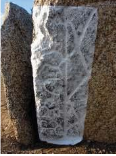
Güneye bakan taşın sol tarafında yer alan damgaların estampajlı görüntüsü