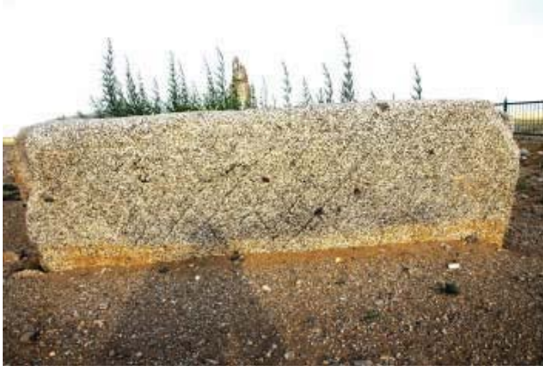
Mezarın batı cephesi

Doğuya ve kuzeye bakan taşların sağ taraflarında, güneye bakan taşın ise, sol tarafında yukarıdan aşağıya doğru sıralanmış damgalar bulunmaktadır. Diğer yüzeylere göre daha fazla yıpranmış olan batıya bakan taş üzerinde yapılan incelemede baklava dilimi şeklindeki motifler tespit edilirken herhangi bir damgaya rastlanmamıştır