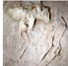
Erzurum'un ( Arayazı ilçesindeki Cunni mağarasının duvarında yer alan teke tasviri 22