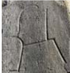
( Öltigin yazıtının doğu yüzündeki teke damgası