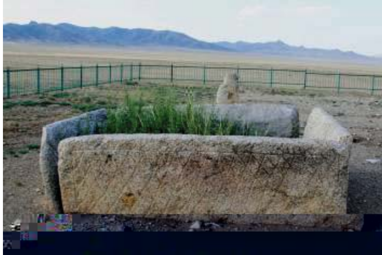
Mezarın güney cephesi