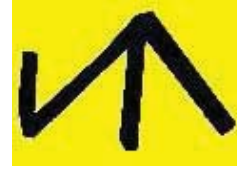
ğuz boylarından Salurlar'a ait damga