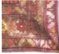
Aynı damganın ( ars yöresine ait bir halı üzerinde tespit edilen görüntüsü 17