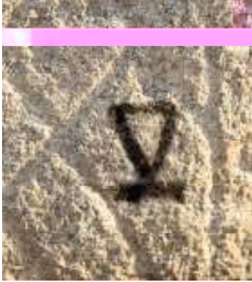
Öngöt mezar külliyesinde tespit edilen damganın filtrelenmiş görüntüsü