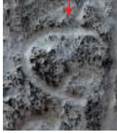
Talas çubuğu üzerinde harf olarak kullanılan ve Ongöt'te tespit edilen damgalardan biri

Yapılan inceleme sonucunda Ongöt'teki mezarın güney cephesinde tespit edilen damgalardan birinin "Talas Çubuğu" adıyla bilenen (T7) üzerindeki bir karakter ile paleografik açıdan aynı olduğu, mezarın kuzey cephesinde yer alan damgaların da hem Talas Çubuğu hem de Esik kurganından çıkarılan tas 19 üzerindeki karakterler ile büyük benzerlikler gösterdiği tespit edilmiştir