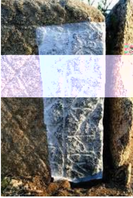
( uzeye bakan taşın sağ tarafında yer alan damgaların estampajlı görüntüsü