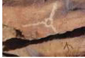
Öngöt'teki damganın Gurvan Mandal'da tespit edilen görüntüsü

Öngöt'te mezarın kuzey cephesinde tespit edilen ve (( ök)türk alfabesinde de λ λ Ψ (iççe) sesinin karşılığı olarak kullanılan harf ?damga