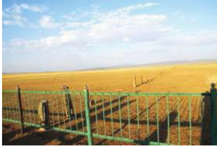
O ngöt mezar külliyesinin 2000 m devam eden balbalları

O ngöt mezar külliyesinin yapısı, içindeki eserlerin şekil özellikleri, yapım teknikleri, külliyesinin I. (( ök)türk ( ağanlığı döneminini yansıtmaktadır. +ira külliyeeye ait sunak masasının sanduka taşlarında bulunan damgalar da bunu açık biçimde desteklemektedir.