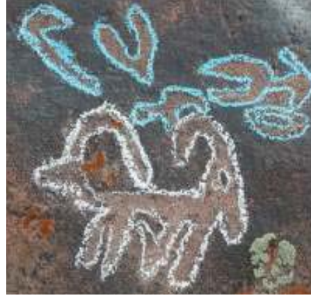
O ngöt'teki mezarın güney cephesinde tespit edilen ve doğu ve batı kağanlığını temsil eden çift başlı teke damgası