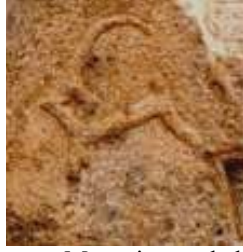
Töv Aymag Müzesi önünde bulunan kaplumbağa kaide üzerindeki teke damgası

Ongöt'te tespit edilen teke damgalarından üçünün filtrelenmiş görüntüleri