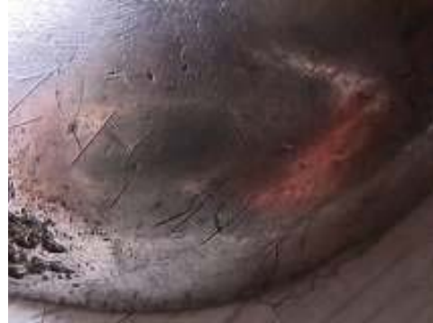
Esik kurganından çıkarılan tasın genel ve ayrıntılı görüntüleri