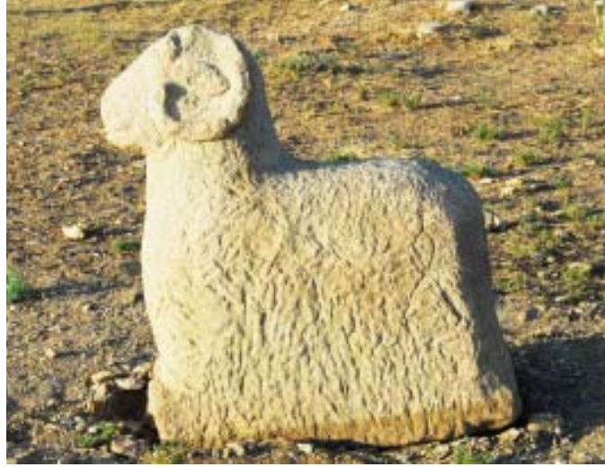
0 ngöt mezar külliyesinde üzerinde damga bulunan koç heykeli 13