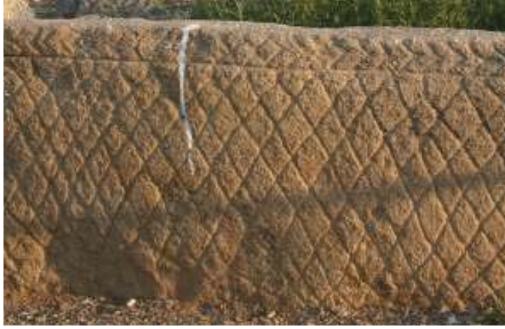
Ongöt'teki mezar taşlarının üst kısımlarında yer alan motiften ayrıntılı bir görüntü

Ongöt mezar külliyesinde (günümüzde) herhangi bir yazıt bulunmamaktadır. Yapılan araştırma ve incelemeler sırasında yazıtta dair bir işarete de rastlanmamıştır. Ancak mezarın sunak masasına ait taşların üzerinde (( ök)türk ve * ygur dönemi mezarlarında karşılaşılan (dikdörtgen çerçeve içinde) baklava dilimlerinden oluşan motifler, üst kenarda 15 cm genişliğinde bugün Anadoludaki bazı kümbet ve mezarlarda da kullanılan bir motif ( ) yer almaktadır