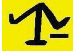
ğuz boylarından Biçeneler'e ait damga

Erzurum'un ( arayazı ilçesindeki Cunni mağarasının duvarında yer alan damgalardan biri