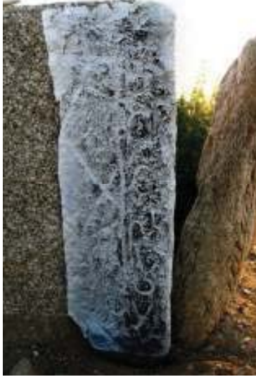
Doğuya bakan taşın sağ tarafında yer alan damgaların estampajlı görüntüsü

Moğolistan coğrafyasında yer alan Türk kültür ve uygarlığına ait eserlerin tamamına yakının üzerinde eserin ait olduğu boyu, aileyi gösteren damgalar bulunmaktadır. Ancak, Bömbögör yazıtı ve Ongöt mezar külliyesinde kağana ait damgaların yanı sıra kağana bağlı alt boyları, aileleri temsil eden damglarla da karşılaşılmaktadır