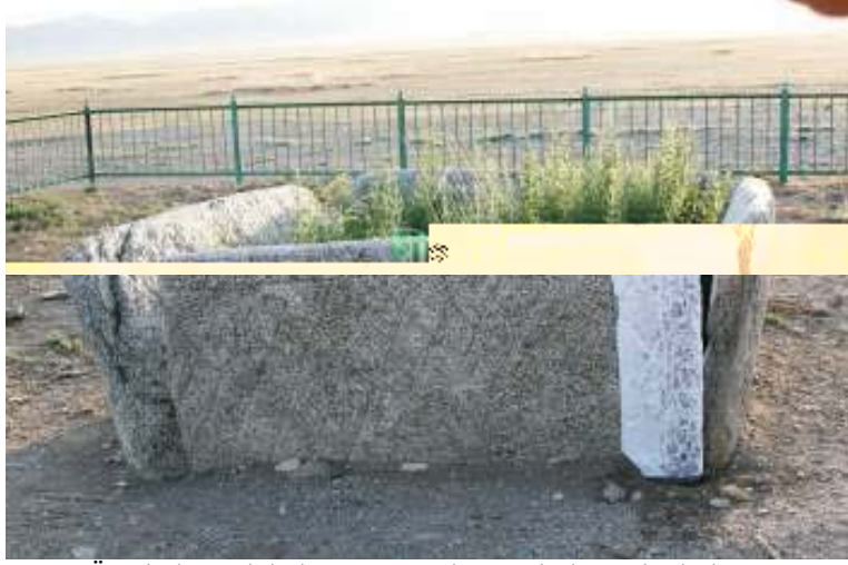
Üzerinde Türk kültür ve uygarlığına ait damgalar bulunan sunak masasının doğu cephesi

+ oğolistan coğrafyasında yer alan Türk kültür ve uygarlığına ait eserlerin tamamına yakının üzerinde eserin ait olduğu boyu, aileyi gösteren damgalar bulunmaktadır. Ancak, ! ömbögör yazıtı ve Ongöt mezar külliyesinde kağana ait damgaların yanı sıra kağana bağlı alt boyları, aileleri temsil eden damglarla da karşılaşılmaktadır