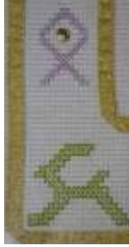
O ngöt mezar külliyesinde tespit edilen (eb) ve teke damganın filtrelenmiş görüntüsü

&azılı iletişimin kaya üstü tasvirlerden sonra ikinci aşamasını teşkil eden damgaların bir kısmı hem kaya üstü tasvirlerle birlikte hem fonetik alfabede seslerin yazıdaki işaretleri olarak hem de fonetik alfabeden sonra günlük hayatta farklı endişelerle kullanımlarını sürdürmüşlerdir.