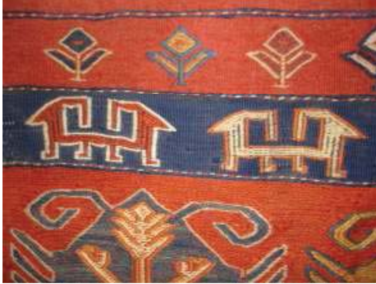
Aynı damganın ( ars yöresine ait bir halı üzerinde tespit edilen görüntüsü