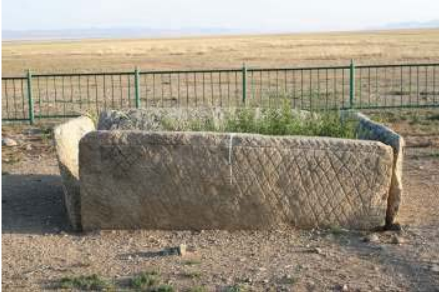
+ ezarın kuzey cephesi