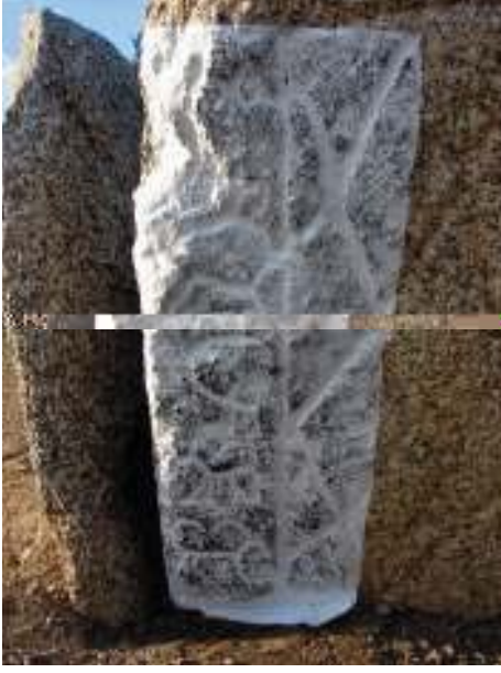
üneye bakan taşın sol tarafında yer alan damgaların estampajlı görüntüsü