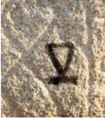
Öngöt mezar külliyesinde tespit edilen damganın filtrelenmiş görüntüsü