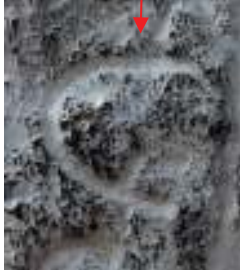
Talas çubuğu üzerinde harf olarak kullanılan ve Ongöt'te tespit edilen damgalardan biri

Yapılan inceleme sonucunda Ongöt'teki mezarın güney cephesinde tespit edilen damgalardan birinin "Talas Çubuğu" adıyla bilenen (T7) üzerindeki bir karakter ile paleografik açıdan aynı olduğu, mezarın kuzey cephesinde yer alan damgaların da hem Talas Çubuğu hem de Esik kurganından çıkarılan tas 19 üzerindeki karakterler ile büyük benzerlikler gösterdiği tespit edilmiştir