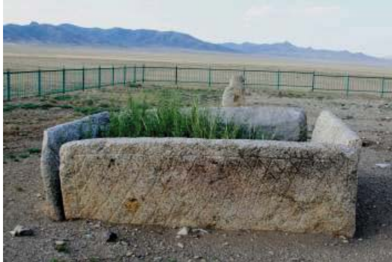
+ ezarın güney cephesi