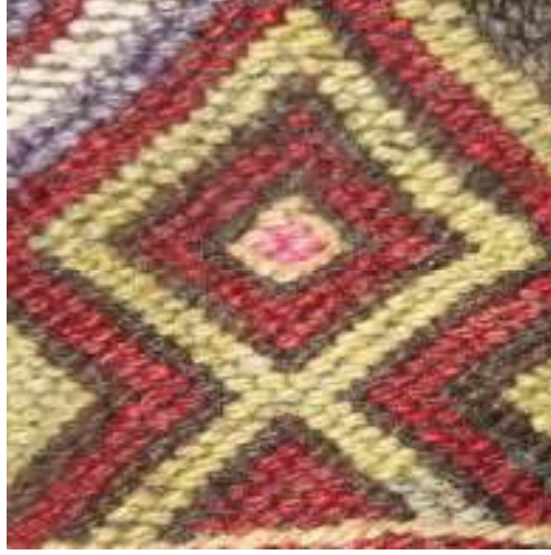
+ ersin'in Erdemli ilçesinde bir çul üzerinde tespit edilen eb damga