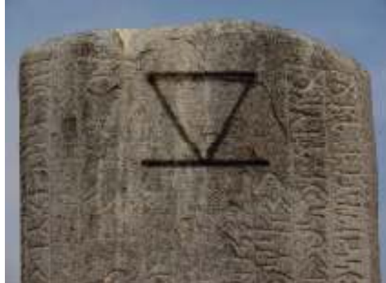
I. İlgel Tonyukuk yazıtı üzerinde yer alan aile damgasının filtrelenmiş görüntüsü

Türk kültür coğrafyasında gerek kaya üstü tasvir olarak, gerekse damga olarak geçiş sıklığı en yüksek hayvan tasviri yüceliği, erişilmez yerlere erişilebilirliği, bağımsızlığı, özgürlüğü, liderliği, kararlılığı, asaleti, cesareti sembolize eden dağ keçisi İekesidir. Türk kültür coğrafyasında + oğolistan'dan Anadolu'ya, Anadolu'dan Avrupa'ya kağanı temsilen veya kağana bağlılığı