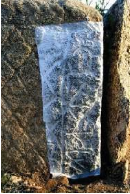
( uzeye bakan taşın sağ tarafında yer alan damgaların estampajlı görüntüsü