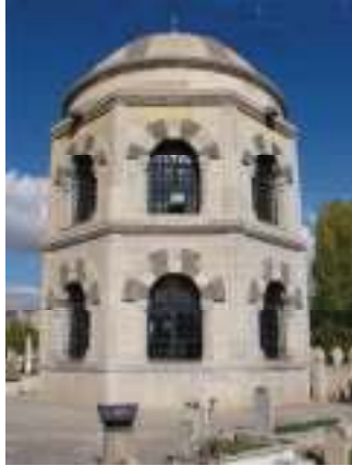
Terzi ! aba Türbesi (Erzincan)