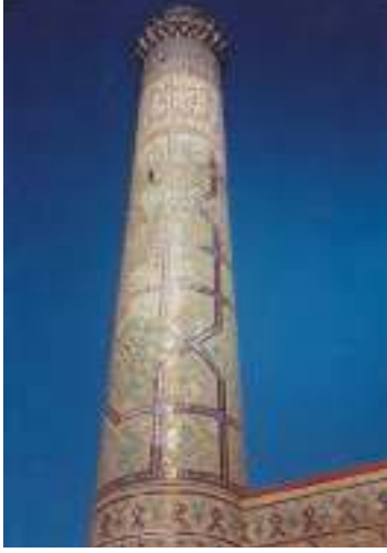
üzerinde eb damgalar bulunan Özbekistandaki İbi 2 atun Camisi'ne ait minare