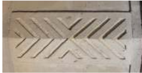
Ongöt'te mezar taşlarının üst kısmında yer alan ve Terzi ! aba Türbesi üzerinde de tespit edilen motif