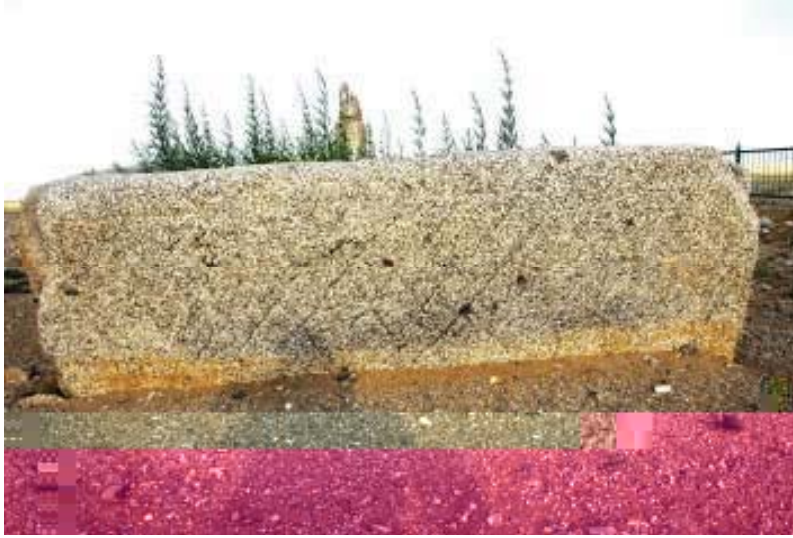
+ ezarın batı cephesi

Doğuya ve kuzeye bakan taşların sağ taraflarında, güneye bakan taşın ise, sol tarafında yukarıdan aşağıya doğru sıralanmış damgalar bulunmaktadır. Diğer yüzeylere göre daha fazla yıpranmış olan batıya bakan taş üzerinde yapılan incelemede baklava dilimi şeklindeki motifler tespit edilirken herhangi bir damgaya rastlanmamıştır