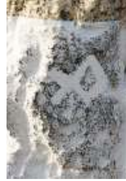
O ngöt mezar külliyesinde tespit edilen ve (( ök)türk alfabesinde de (eb) ince ; sesini karşılayan harf ?damga

Erzurum'da bir etamin üzerinde tespit edilen (eb) ve teke damga (Foto. Dr. C.A & I + A+)