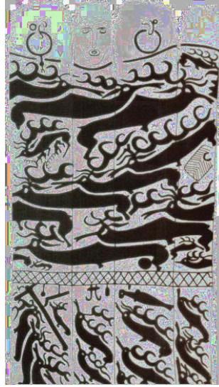
Şekil 1. İnsan tasvirli geyikli taş, Uşkiyn-Uver, Moğolistan. Taşın üzerinde insan yüzü, kulaklarındaki halka küpeler, belindeki askılı kemer, kemere sağdan bağlanmış balta ve soldan asılmış hançer tasvir edilmiştir ( Volkov ve Novgorodova'dan).