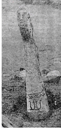
Fotoğraf 1. Ucu hafif öne doğru eğilmiş ve insan yüzü şeklinde çalışılmış geyikli taş, Argın-brigada, Kuzey Moğolistan (Novgorodova'dan).