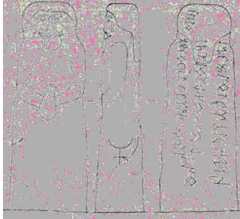
Şekil 2. Yazılı Göktürk heykeli. Znamenki köyü, Erba ırmağı yakınları, Hakasya. Devon taşı, H=1,74, genişlik 55-64 cm. Minusinsk Müzesi, No. 12 (Кызласов'dan ).