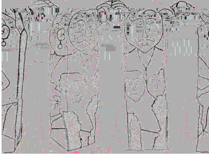
Şekil 6. Elinde düşmanlarının kesilmiş kafalarını tutan dövüşçü heykeli, Göktürk Dönemi, Ak-Tal-Bacı, Henderge ırmağı, Tuva (Кызласов'dan).