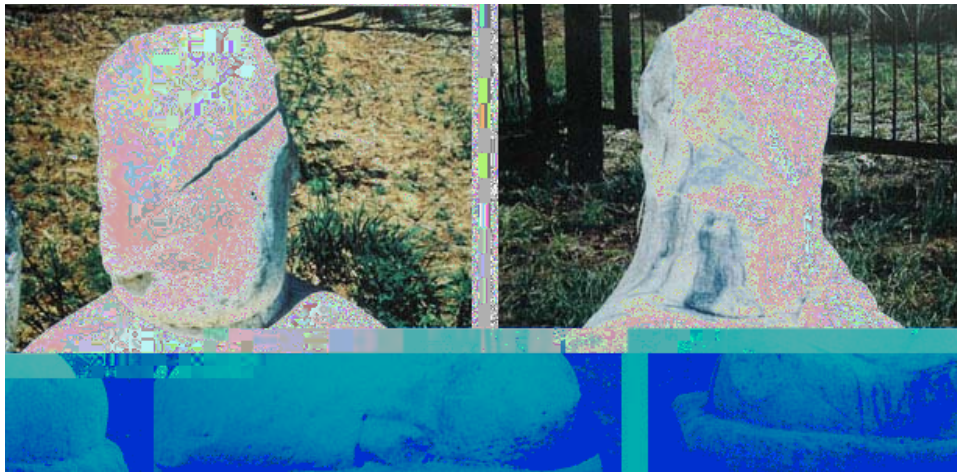
Fotoğraf 2. Bilge kağan mezar külliyesinden oturan Bilge Kağan ve eşine ait heykeller (Alyılmaz'dan).