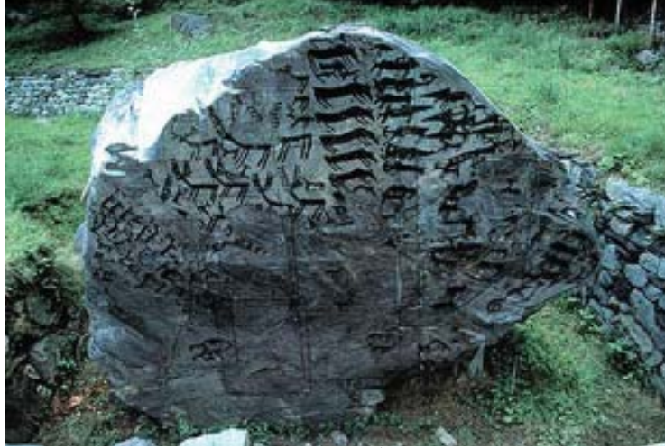
Fotoğraf 9: İtalya ( http://www.euopreart.net/slide.htm 10.5.2008)