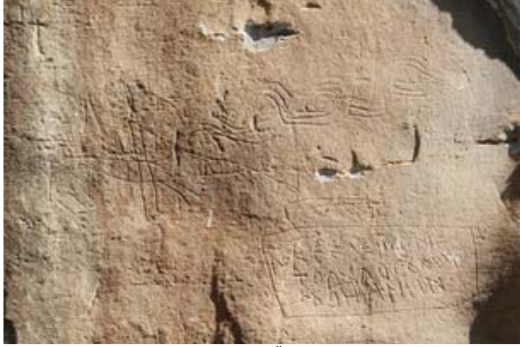
Fotoğraf 29: Esatlı Kaya Üstü Resim ve Yazıtların Bulunduğu Alanda Canavar

Esatlı köyü kaya üstü resimleri arasında yer alan canavar figürü ilgi çekicidir: