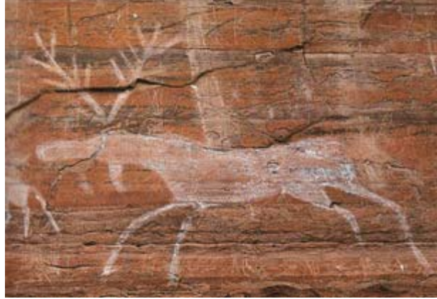
Fotoğraf 4: Rusya-Sibirya – IRKUTSK- Lena Kaya Resimleri