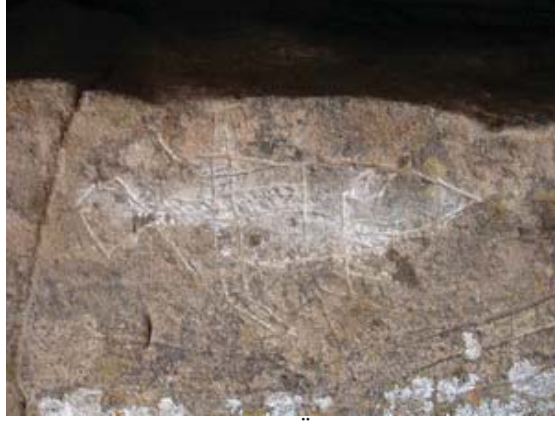
Fotoğraf 23: Esatlı Kaya Üstü Resim ve Yazıtların Bulunduğu Alanda Balık

Esatlı kaya üstü resimleri arasında dikkat çeken figürlerden biri de balıktır. Balık figürü de Gök Tanrı inanç sisteminin bir unsurudur.