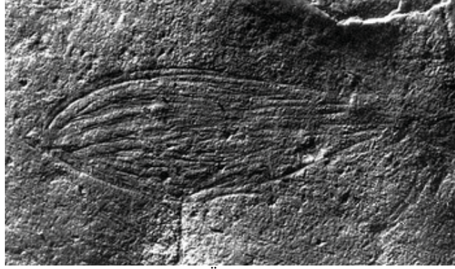
Fotoğraf 26: Kaya Üstü Balık Figürü - Fransa