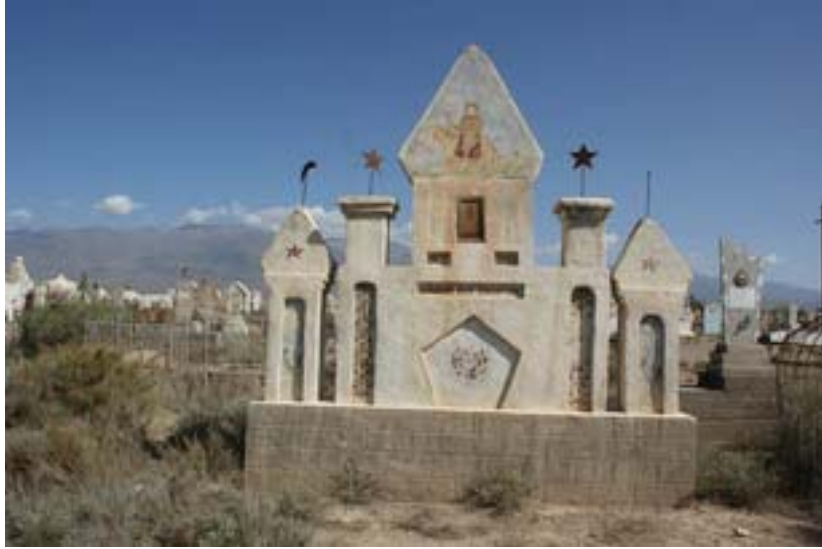
Fotoğraf 18: Kırgızistan-Issıkgöl Mezar Taşı