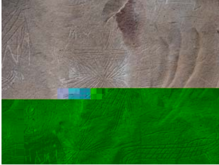
Fotoğraf 19: Esatlı Kaya Üstü Resim ve Yazıtların Bulunduğu Alanda Güneş ile Ay