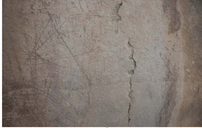
Fotoğraf 3: Esatlı Kaya Üstü Resim ve Yazıtların Bulunduğu Alanda Geyik Figürü

Esatlı köyü yazıtları arasında bulunan figürlerin en önemlilerinden birisi geyiktir. Geyik figürü, toz tabakası tarafından örtülmüş olduğu için 1994'te yaptığımız ilk incelemelerimizde tespit edilememişti. Daha sonraki araştırma ve incelemelerimizde fırça ile kayalar özenle süpürülmüştür. Süpürme sırasında ortaya çıkan figürlerden birisi de geyiktir.