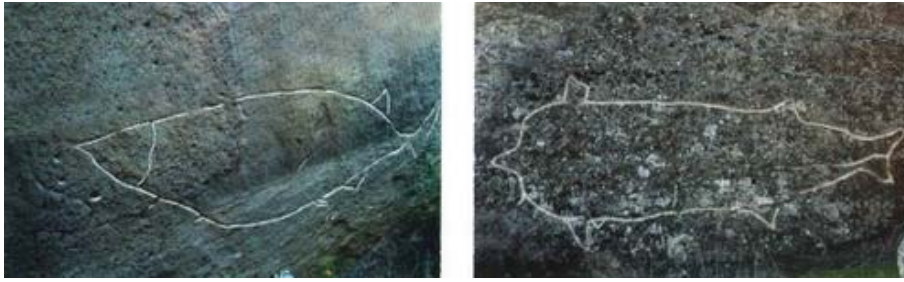
Fotoğraf 24-25: Azerbaycan – Kubistan (Çizim: İ. M. Caferzade, Kubistan, Bakü-1997)

Azerbaycan-Kubistan ve Fransa kaya üstü resimleri arasında rastladığımız balık, Esatlı köyündeki ile hemen hemen aynı özellikleri göstermektedir.