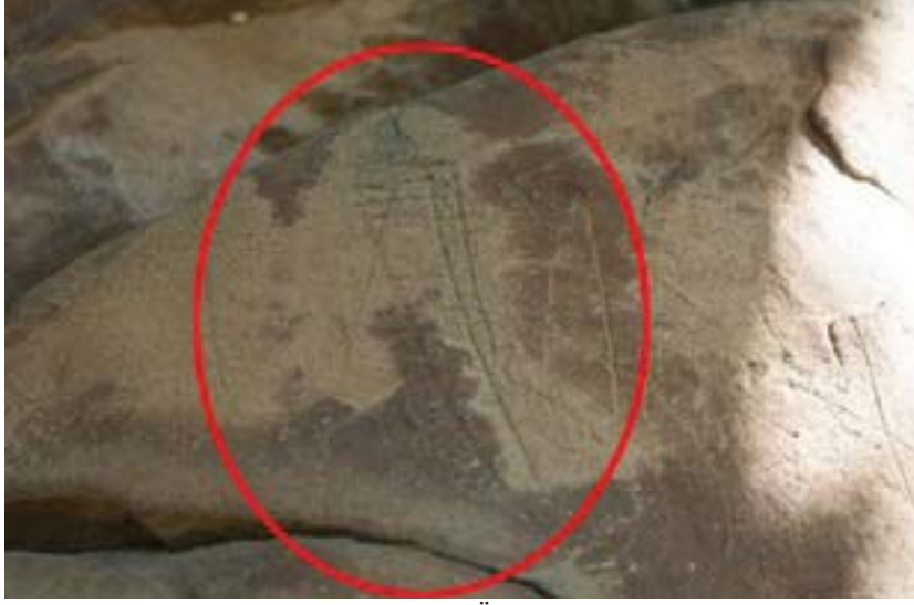
Fotoğraf 27: Esatlı Kaya Üstü Resim ve Yazıtların Bulunduğu Alanda Kurban Baltası