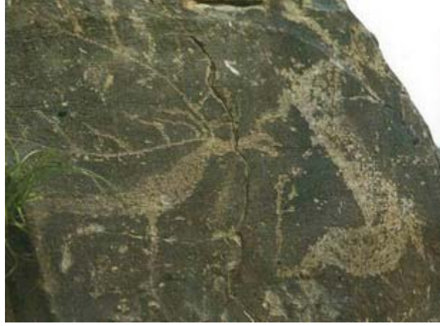
Fotoğraf 5: Moğolistan – Arhangay Kaya Resimleri