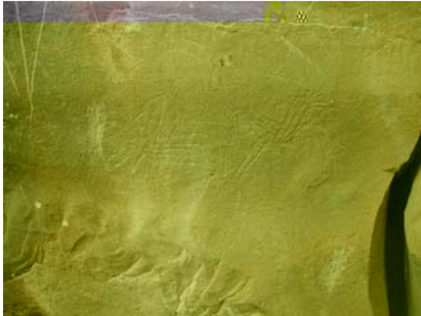
Fotoğraf 10: Esatlı Kaya Üstü Resim ve Yazıtların Bulunduğu Alanda Atlar ve Avcılık