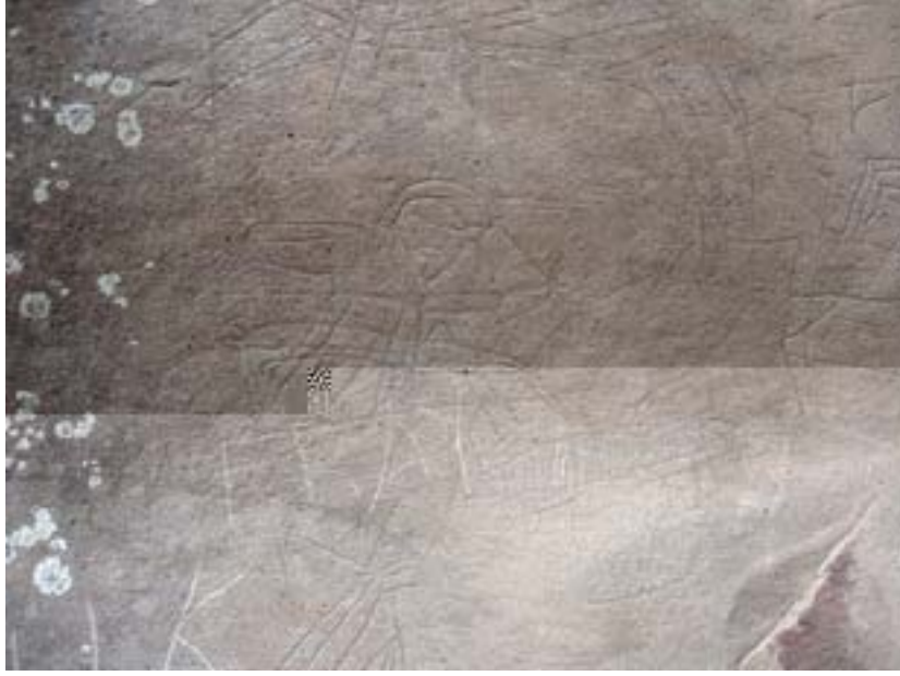
Fotoğraf 15: Esatlı Kaya Üstü Resim ve Yazıtların Bulunduğu Alanda Doğanlı Bey