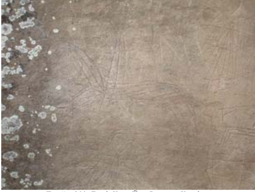
Fotoğraf 11: Esatlı Kaya Üstü Resim ve Yazıtların Bulunduğu Alanda Atlar ve Avcılık