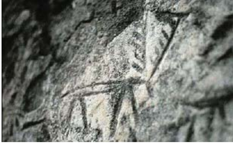
Fotoğraf 8: Avusturya ( http://www.euopreart.net/slide.htm 10.5.2008)