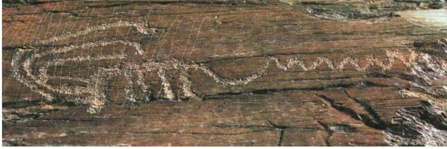
Fotoğraf 30: Moğolistan- Gobi Çölü (S. Somuncuoğlu, Sibirya’dan Anadolu’ya Taştaki Türkler , s.82.)