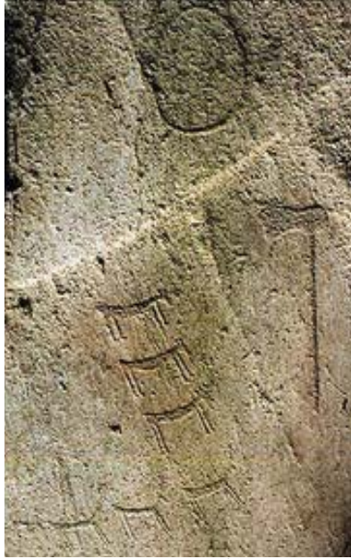
Fotoğraf 28: İtalya ( http://www.euopreart.net/slide.htm 10.5.2008)