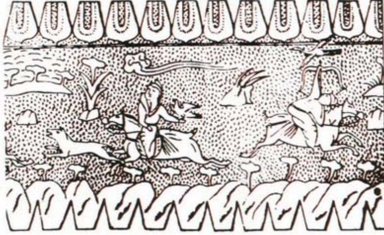
Fotoğraf 17: Köktürk Dönemi-Gümüş Tabaka-Av Sahnesi (Türkler Ansiklopedisi, C. 2, s. 91).

The Petroglyphs and Inscriptions in Esatlı Village (Ordu-Mesudiye) and Their Historical Background