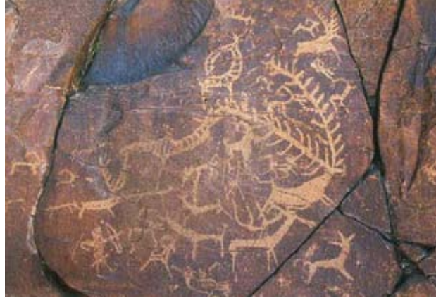
Fotoğraf 6: Moğolistan-Gobi Çölü