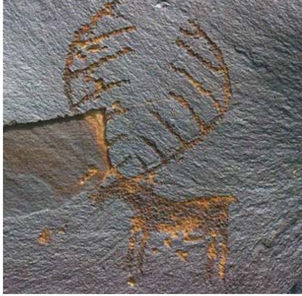
Fotoğraf 7: Kırgızistan- Kazarman Saymalıtaş