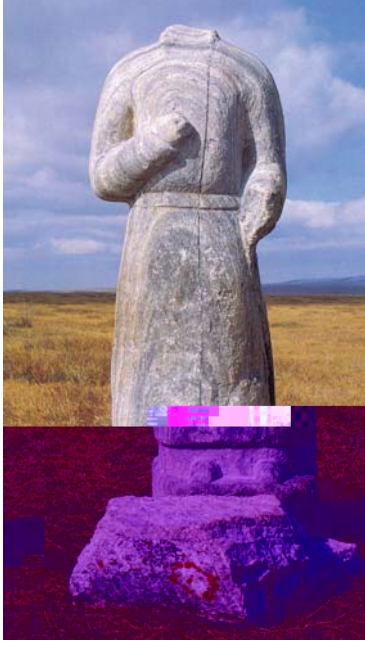
3. Bilge Kağan için yapılan külliye de bulunan silahsız bir erkek heykeli, 20 Eylül 735, Arhangai Aymak – Moğolistan.