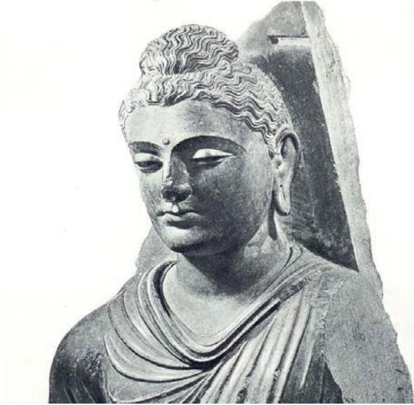
6. Gandhara ekolünde yapılmış bir Buda başı, ~ M.S. 500ler, Peşaver Müzesi, Hindistan.