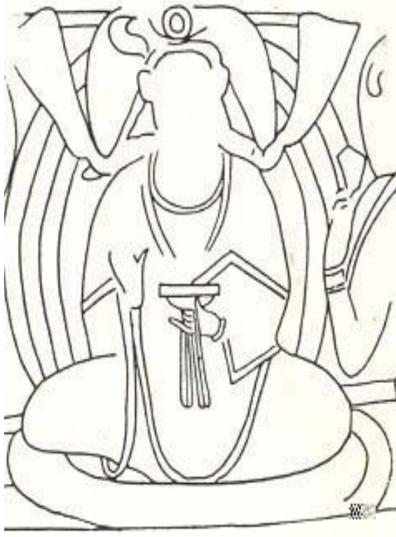
7. Balalık-tepe freskolari, "hediye alan soylu sahnesi"nden detay, ~ 7-8. yy.lar, Tacikistan.