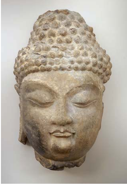
5. Tang dönemi Çin'ine ait bir Buda başı, ~ M.S. 700ler, Freer Gallery of Art, Smithsonian, Washington D.C.