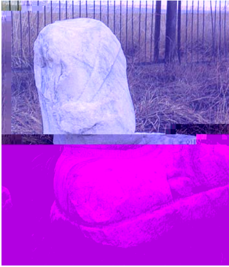
4. Bilge Kağan külliyesindeki, Bilge Kağan'a atfedilen heykel, 20 Eylül 735, Arhangai Aymak – Moğolistan.