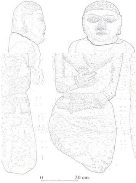
2. Bir başka Göktürk ileri geleni için yapılmış heykel, ~ M.S. 8. yy.ın ilk yarısı, Petropavlosk Müzesinde, Karabalta – Kırgızistan.