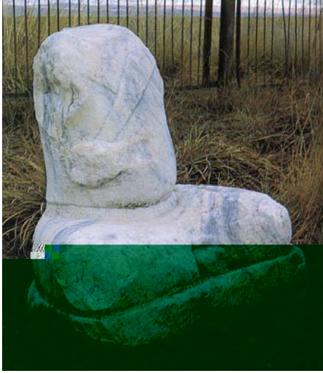
4. Bilge Kağan külliyesindeki, Bilge Kağan'a atfedilen heykel, 20 Eylül 735, Arhangai Aymak – Moğolistan.