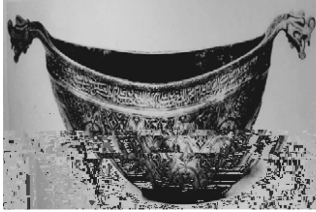
Resim 5. Keşkül örneği. Paris Baron M. de Rothschild Koleksiyonu (Harari 1967)