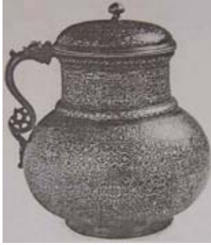
Resim 8. Üstünde Kasım el Envar'a ait beyit yazılı 1484 tarihli maşrapa. Nuhad Es-Said Koleksiyonu (Komaroff 1992b).