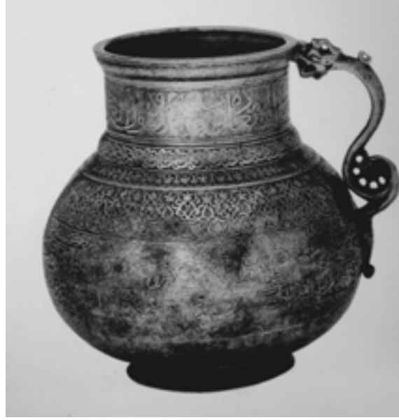
Resim 7 a-b. 1461-62 tarihli maşrapa. Londra Victoria ve Albert Müzesi (Lentz vd. 1989 )