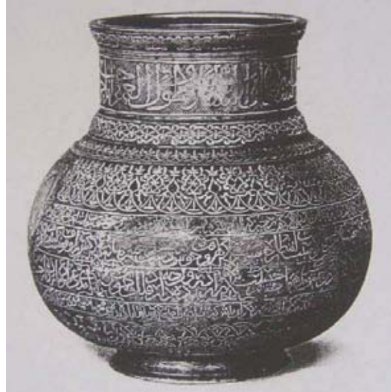
b. (Harari 1967)