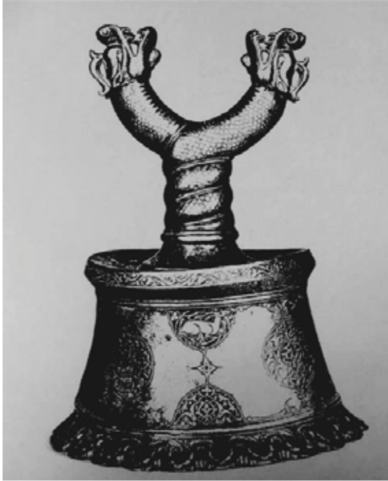
Resim 11. Ejderli şamdanlara bir örnek. Leningrad St. Petersburg Müzesi (Harari 1967)