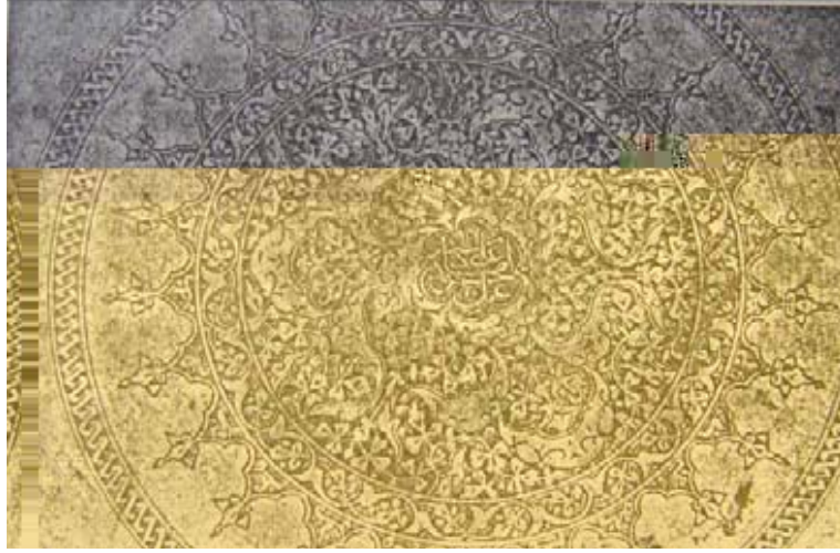
b. (Komaroff 1992b)