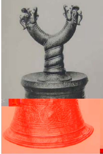
Resim 9. Üstünde Salihi'nin beyiti yazılı şamdan. Kahire İslam Müzesi (Harari 1967)