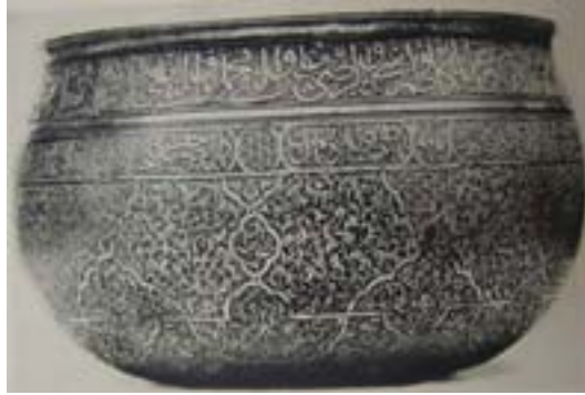
Resim 4. Kase örneği. New York Metropolitan Müzesi (Harari 1967)