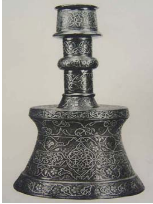
Resim 3. Şamdan örneği. Şu an yeri bilinmiyor (Harari 1967)