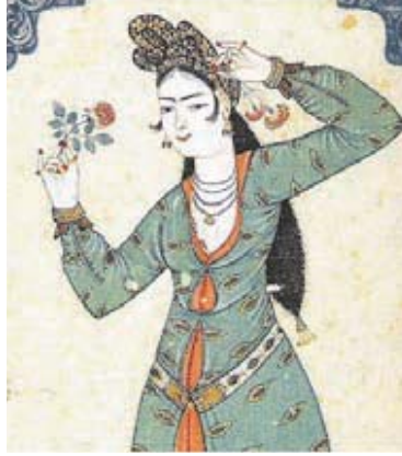
Resim 1: Yeşil Giysili Kadın, TSM. H. 2164, 15b. (İrepoğlu 1999: 196).

● Dikmen, Çetin, Klâsik Türk Şiirinde Kadın Takı ve Aksesuarları ●