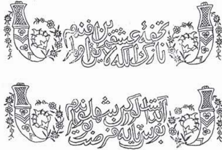
Resim 5: Bir delikanlıya hediye edilmiş hançer motifli ve âşıkâne beyitli dest-mâl. Tuhfe-i aşkı ben efendim / Nâzik eline lâynk olam / Abdest alurken şehlevendim / Bûs-i pâyine fırsat bulam (Koçu 1969: 88).