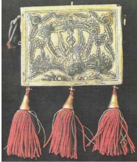
Resim 2: Tombak ve Savat Teknikler Bir Arada Kullanılmış Çok Değişik Bir Kadın Hamayısı (Kuşoğlu 1994: 48).