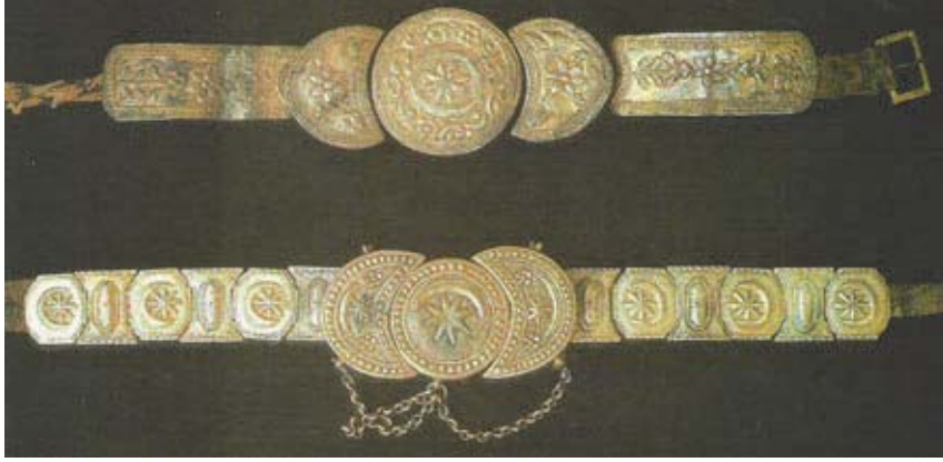
Resim 4: İki Ayrı Gümüş Kakma Bâzûbend (Kuşoğlu 1994: 138).