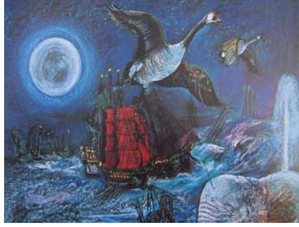
Resim 10. Cihat Burak, Mobidik, 1979

Resimlerinde öyküsel anlatımlara yer veren Ressam Cihat Burak, Köroğlu, Pehlivanlar, Atatürk, Nazım Hikmet gibi resimlediği kişilerin yaşam öykülerine yer verir. Diğer yandan yaşamın çarpıklıklarına da mizahi bir anlayışla yaklaşarak masalımsı anlatımlarla renkli ağaçlar, parlak gökyüzü, ay ve güneş tasvirleri yapmıştır. Cihat Burak'ın "Mobidik" adlı resmindeki masalımsı anlatım, ayın gizemli varlığıyla bir düşe dönüşmüş olup, içten bir anlatımın benimsendiği bu tabloda ay, bir masal ülkesini anlatır gibidir (R.10).