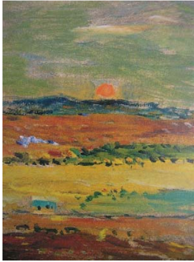
Resim 9. Resim Eşref Üren, Oran'da Akşam, 1970

İbrahim Çallı'nın öğrencisi olan Eşref Üren'in resimlerinde daha çok Ankara görüntüleri yer alır. "Oran'da Akşam" adlı tablosunda güneş bir turuncu top gibi resmin merkezini oluşturmaktadır (R.9).