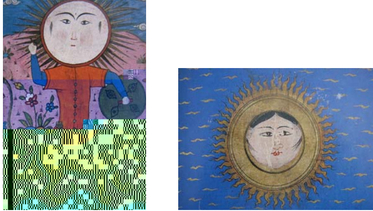
Resim 2. Acaibü'l Mahlukat

Osmanlı minyatürlerinde güneş de yedi gezegenden biri olarak yerini alır. Güneş; Şems, Mihr, Hur gibi adlar alır. Yıldızların en parlağı olup, bütün yıldızları görünmez yapar ve Ay'a ışık verir. Denizi, karayı canlıları etkiler. Isısıyla buharlaşma olur, bunun sonucu olarak bulutlar oluşur, yağmura neden olur, bitkiler yeşerir. Canlılar güç kazanır. Güneş (resim 2), minyatürlerde değişik şekillerde yer alır. Büyük yuvarlak insan yüzü şeklinde, çevresinde sarı alevler şeklinde tasvir edildiği gibi aslan burcu ile güç, gösteriş simgesi olan Güneş özdeşleştirilmektedir (And,1998).