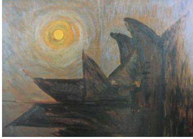
Resim 7. Nurettin Ergüven, Fethiye'de Gurub, 1969

Cumhuriyet Dönemi ve sonrasında ise, 1933 de D Grubu Ressamları ve Müstakiller içinde resimde güneş ve ay motifine pek rastlanmaz. Herhangi bir gruba dahil olmadan resimde anlam ve öyküleme üzerine ağırlık veren çoğu ressamın eserinde güneş ve ay motifi görülmektedir. Örneğin; Nurettin Ergüven'in "Fethiye'de Gurub" adlı tablosunda olduğu gibi bazı resimlerde güneş, doğrudan doğruya bir obje olarak yer alır. Yine Ergüven'in "Peyzaj" adlı tablosunda da ay, obje olarak olabildiğince kocaman ve resme hakim olarak resmin merkezinde görülmektedir (R.7-8).