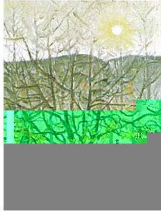
Resim 6. Nevzat Akoral, Akşama Doğru, 1926

Yine Nevzat Akoral'ın "Akşama Doğru" resminde, güneş motifinin çok belirgin ve aktif olarak resmin tümüne hakim olarak görülür (R.6).