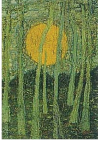
Resim 4. Fahir Aksoy, Güneşli Peyzaj, 1916

Akademi eğitimi alıp, çocuksu duyarlılığını hiç kaybetmemiş olan Ressam Fahir Aksoy'un "Güneşli Peyzaj" resminde güneş, turuncu renkte eserin tümüne hakim olarak görülmektedir (R.4). Aksoy'un, gündelik hayatın görüntülerini aktardığı ve en ince ayrıntısına kadar işlediği "Bahçem" (R.5) adlı resminde ise yine güneşi, turuncu bir top gibi resmin başköşesine yerleştirmiştir.