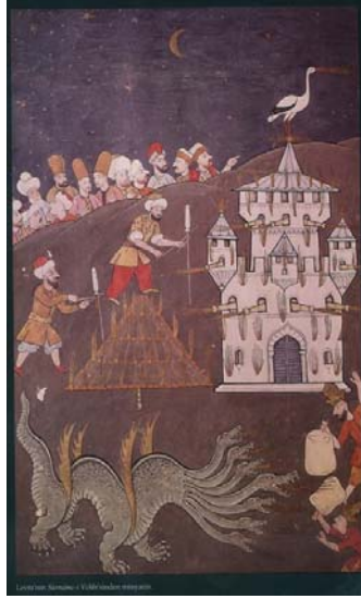
Resim 3. Levni, Surname-i Vehbi