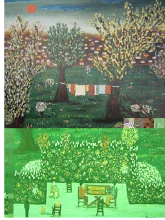
Resim 5. Fahir Aksoy, Bahçem, 1916

Yine Nevzat Akoral'ın "Akşama Doğru" resminde, güneş motifinin çok belirgin ve aktif olarak resmin tümüne hakim olarak görülür (R.6).