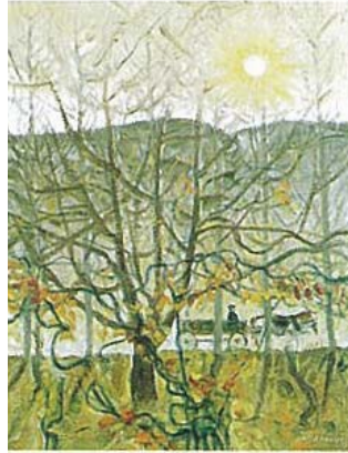
Resim 6. Nevzat Akoral, Akşama Doğru, 1926

Yine Nevzat Akoral'ın "Akşama Doğru" resminde, güneş motifinin çok belirgin ve aktif olarak resmin tümüne hakim olarak görülür (R.6).