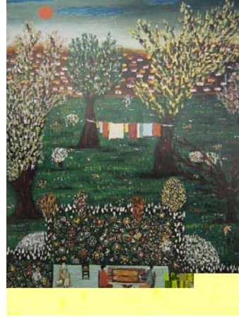
Resim 5. Fahir Aksoy, Bahçem, 1916

Yine Nevzat Akoral'ın "Akşama Doğru" resminde, güneş motifinin çok belirgin ve aktif olarak resmin tümüne hakim olarak görülür (R.6).