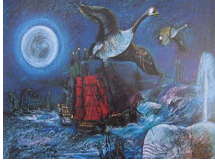
Resim 10. Cihat Burak, Mobidik, 1979

Resimlerinde öyküsel anlatımlara yer veren Ressam Cihat Burak, Köroğlu, Pehlivanlar, Atatürk, Nazım Hikmet gibi resimlediği kişilerin yaşam öykülerine yer verir. Diğer yandan yaşamın çarpıklıklarına da mizahi bir anlayışla yaklaşarak masalımsı anlatımlarla renkli ağaçlar, parlak gökyüzü, ay ve güneş tasvirleri yapmıştır. Cihat Burak'ın "Mobidik" adlı resmindeki masalımsı anlatım, ayın gizemli varlığıyla bir düşe dönüşmüş olup, içten bir anlatımın benimsendiği bu tabloda ay, bir masal ülkesini anlatır gibidir (R.10).