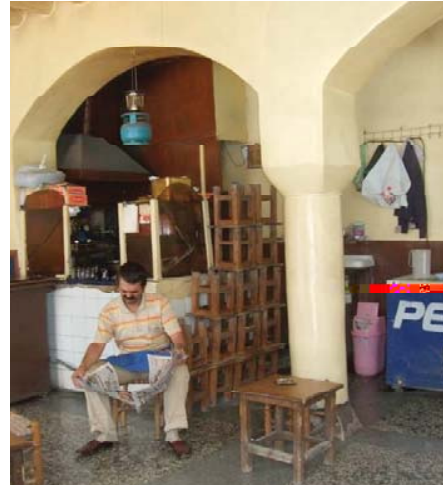
Resim 11. Tarihi Borsa Hamı Kahvehanesinin ön cephesi ve iç mekanı (Diyarbakır, 2009).