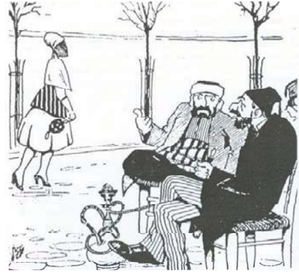
Resim 4. Sokakta sosyal hayat'; (Ayine, no.28, Mart 1992, Aktaran: Georgeon 1999:62).

sında kültürel dönüşümü eğlence olgusuyla birleştirerek değişimin en önemli figürleri haline geldikleri söylenebilir. Osmanlı toplumsal hayatının yeniden kodlanan sürecini yaşama sokan Tanzimat Fermanı sonrası hayat bulan kültürel çeşitlilik, toplumsal gruplar arası esnek geçişler ve sosyal zenginliğin sokağa yansıyan tezahürüyle işlevini zenginleştiren kahvehaneler; ev-cami-çarşı üçlüsü etrafında sıkışan hayata yeni bir ruh getirmiştir.