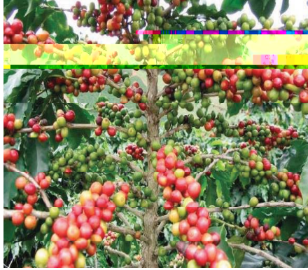
Resim 3. Kahve ağacı ve meyvesi.

Kahve, aynı isme sahip ve fidan boyunda olan küçük bir ağacın meyvesi (Resim 3) olarak bilinmektedir. Yemen'in en sıcak bölgelerinde yetişen kahve, fındık gibi sert bir kabuk içinde bulunur ve kabuk kırılınca içinde kahve çekirdekleri çıkar. Yemen kökenli olarak bilinen kahvenin 16. yüzyılın ilk yarısında Suriye'ye ve bu ülke üzerinden de İstanbul'a(1554) getirildiği rivayet edilmektedir (David 1998:125). Kahvenin ortaya çıkışıyla birlikte bu içecek maddesinin uzun bir zaman aralığında yalnızca Araplar tarafından kullanıldığı bilinmektedir. Bir asır sonrasında da kahve, Suriye, Mısır, İran ve Hindistan'da yayılmaya başlamıştır. Kahvenin Yakınoğu ülkelerinde yayılarak İstanbul'a gelişi ve burada ilk kahvehanelerin açılması 1555 yılında olmuştur (Birsal 2009:11).