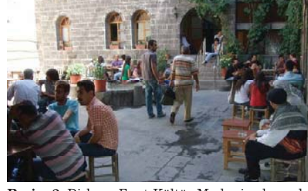
Resim 2. Dicle ve Fırat Kültür Merkezi avlusunda toplumsal cinsiyetin mekân ve zaman paylaşımı (Diyarbakır, 2009).

Yakındoğu'nun birçok şehrinde sınırlı bir işleve sahip kahve dükkânlarından daha farklı ve gösterişli olan kahvehanelerin İstanbul ve Anadolu'nun farklı şehirlerinde var olduğu bilinmektedir. Anadolu'nun mistik bir bölgesinde yer alan Diyarbakır, eski kahvehanelerinde üstü hasırlarla örülmüş kürsüler (tahta oturak) yapının önüne bırakılarak, açık havada gelip geçeni seyretmek, sohbet ortamı yaratmak ve nargile içenlere dinlenme olanağı sunulabilmekteydi. Eski kahvehaneler özel alan ile kamusal alan arasında işlevsel veya kılışsal sonuçlara önsel olarak atıfta bulunulmayan erkeklere özgü mekân örnekleridir. Günümüz kent yaşamında ise, kamusal sosyal mekân kavramının erkeklerle; özel kavramın da kadınlarla özdeşleştirilmeyeceği bir görünüm sergilemektedir (Resim 2).