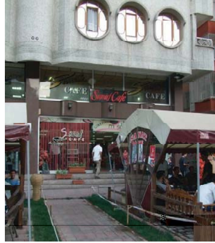
Resim 12. Sanatın sözde kaldığı Sanat Sokağı ve Kafeler dizisi (Diyarbakır, 2009).

Küresel dönüşümler; dünyada geleneksel değerlerin ontolojisine ket vururken, kültür endüstrileri denen olgular (sanatlar, turizm ve boş zamanlar) toplumsal alanın yeni belirleyicileri olmuştur (Urry 1999:12). Kültürlerin mekânlarıyla birlikte üretilip tüketilen bir ticari ürün haline getirildiği küresel ekonomide; kültürel ürünlerin za-