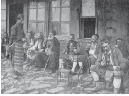
Resim 10. Bugün yerinde başka bir bina olan Nargileciler Kahvehanesi; Diyarbakır-Balıkçılarbaşı, 1909.

Ortadoğu şehirlerinde (Kahire, Halep v.b) olduğu gibi, Diyarbakır'da da simgesel bir mimari yaklaşımla ya da kültürel bir kimlik kaygısıyla tasarlanmış kahvehane yoktur veya en azından bizler bilmiyoruz (Resim 10). Kahvehanelerin şehrin nirengi noktalarında yer alan cami, hamam, kilise ve pazar yerlerine yakın olması; bu mekânların toplumsal kabullerde kültürel kaynaşmasını yansıtmaktadır.