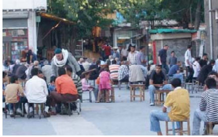
Resim 1. Ulucami'nin önü ve erkek cinsiyetine dayalı toplumsal görünüm (Diyarbakır, 2009).

Toplumsal temsiliyeti sağlayan kahvehanelere gitme arzusunda, bu mekânlara bir fincan kahve içme isteği ile değil; sosyal bir ortama girme, eğlenme ve başka kişilerle görüşme talebi belirleyici olabilmektedir (Deniş 2008). Kahvehaneler; var oldukları toplumsal hayatın içinde sosyo-kültürel yaşamda köklü değişimlere sirayet ederek, evin dışında (Resim 1) gelişebilen bir toplumsal hayatın önünü açmıştır. Geleneksel Türk toplum hayatında önemli bir yere sahip olan kahvehaneler; toplumsal iletişim biçimlerini yönlendirebilmeyi sağlayan kamusal alanlardan biri olmuştur. Toplumun geleneksel hayat tarzıyla bütünleşmiş olan bu mekânlar; yüzyıllardan beri toplumsal hayat içinde yer alarak, boş zamanlara yer açmanın yanında siyaset, güncel sorunları paylaşma ve kültürel işlevlerle toplum katmanları arasında bir iletişim aracı olarak görev üstlenmiştir.