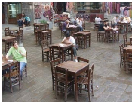
Resim 7. Hasanpaşa Hamı ve orta yerinde yer alan şadırvan etrafında ve avluda oturan farklı kesimdeki insanlar (Diyarbakır, 2009).

İslami kentin toplumsal hayatına katılan kahvehane; kentin yaşamına ve kültürüne sirayet etmesi uzun yıllar almıştır. “Bu yeni buluşma mekânıyla birlikte toplumsal ilişkilerde bambaşka bir anlayış ortaya çıkmış ve o güne dek cami ile hamamda gelişen toplumsal ilişkiler üzerine kurulu ortak yaşantıda, muhtemelen yepyeni bir örgütlenme söz konusu olmuştur” (David 1998:125) ve bu sürecin tezahürü, toplumsal katmanların kültürel dokularına sirayeti şeklinde gelişmiştir. Naima; kahvehaneleri ilk kuruluş dönemlerindeki işlevlerini dikkate alarak, “Mecma-i Zürefa” deyimini kullanmıştır. Bu deyimde birer kamusal mekân olan kahvehaneler; güzel konuşmaların icra edildiği toplantı yeri ve akademik buluşmaların hayat bulduğu yerler olarak tanımlanmaktadır (İşoğlu, 10.03.2009). Türkiye’de süregelen sosyal ve toplumsal değişimlerle birlikte kamusal mekânlarda(Kahvehaneler) bu değişimlerden olumsuz bir şekilde etkilenmişlerdir. Özellikle 1980’lerden sonra bölgede yaşanan terör olgusu Diyarbakır gibi şehirlerde kahvehanelerin toplumsal işlevlerini cılızlaştırarak, bu mekânları farklı bir sosyal işlevin içine sokmuştur. Suriçi tarihi kentsel dokusu içinde yer almış olan tarihi kahvehanelerin çoğu kapanmış, yıkılmış ya da benzer nedenlerden ötürü yok olduğu için ilk kahvehanelerin yapısal dokusu hakkında kesin bilgilere ulaşmak zorlaşmıştır (Resim 8).