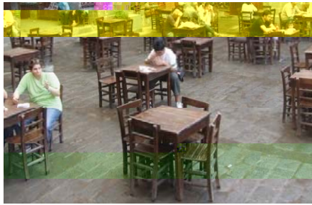
Resim 7. Hasanpaşa Hamı ve orta yerinde yer alan şadırvan etrafında ve avluda oturan farklı kesimdeki insanlar (Diyarbakır, 2009).

İslami kentin toplumsal hayatına katılan kahvehane; kentin yaşamına ve kültürüne sirayet etmesi uzun yıllar almıştır. “Bu yeni buluşma mekânıyla birlikte toplumsal ilişkilerde bambaşka bir anlayış ortaya çıkmış ve o güne dek cami ile hamamda gelişen toplumsal ilişkiler üzerine kurulu ortak yaşantıda, muhtemelen yepyeni bir örgütlenme söz konusu olmuştur” (David 1998:125) ve bu sürecin tezahürü, toplumsal katmanların kültürel dokularına sirayeti şeklinde gelişmiştir. Naima; kahvehaneleri ilk kuruluş dönemlerindeki işlevlerini dikkate alarak, “Mecma-i Zürefa” deyimini kullanmıştır. Bu deyimle birer kamusal mekân olan kahvehaneler; güzel konuşmaların icra edildiği toplantı yeri ve akademik buluşmaların hayat bulduğu yerler olarak tanımlanmaktadır (İşoğlu, 10.03.2009). Türkiye’de süregelen sosyal ve toplumsal değişimlerle birlikte kamusal mekânlarda (Kahvehaneler) bu değişimlerden olumsuz bir şekilde etkilenmişlerdir. Özellikle 1980’lerden sonra bölgede yaşanan terör olgusu Diyarbakır gibi şehirlerde kahvehanelerin toplumsal işlevlerini cılızlaştırarak, bu mekânları farklı bir sosyal işlevin içine sokmuştur. Suriçi tarihi kentsel dokusu içinde yer almış olan tarihi kahvehanelerin çoğu kapanmış, yıkılmış ya da benzer nedenlerden ötürü yok olduğu için ilk kahvehanelerin yapısal dokusu hakkında kesin bilgilere ulaşmak zorlaşmıştır (Resim 8).