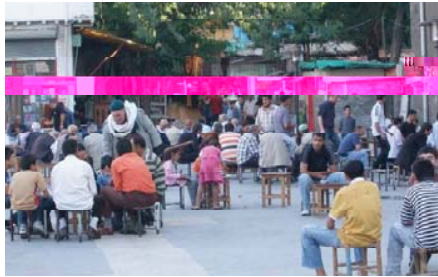
Resim 1. Ulucami'nin önü ve erkek cinsiyetine dayalı toplumsal görünüm (Diyarbakır, 2009).

Toplumsal temsiliyeti sağlayan kahvehanelere gitme arzusunda, bu mekânlara bir fincan kahve içme isteği ile değil; sosyal bir ortama girme, eğlenme ve başka kişilerle görüşme talebi belirleyici olabilmektedir (Deniş 2008). Kahvehaneler; var oldukları toplumsal hayatın içinde sosyo-kültürel yaşamda köklü değişimlere sirayet ederek, evin dışında (Resim 1) gelişebilen bir toplumsal hayatın önünü açmıştır. Geleneksel Türk toplum hayatında önemli bir yere sahip olan kahvehaneler; toplumsal iletişim biçimlerini yönlendirebilmeyi sağlayan kamusal alanlardan biri olmuştur. Toplumun geleneksel hayat tarzıyla bütünleşmiş olan bu mekânlar; yüzyıllardan beri toplumsal hayat içinde yer alarak, boş zamanlara yer açmanın yanında siyaset, güncel sorunları paylaşma ve kültürel işlevlerle toplum katmanları arasında bir iletişim aracı olarak görev üstlenmiştir.