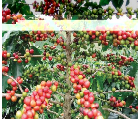
Resim 3. Kahve ağacı ve meyvesi.

Kahve, aynı isme sahip ve fidan boyunda olan küçük bir ağacın meyvesi (Resim 3) olarak bilinmektedir. Yemen'in en sıcak bölgelerinde yetişen kahve, fındık gibi sert bir kabuk içinde bulunur ve kabuk kırılınca içinde kahve çekirdekleri çıkar. Yemen kökenli olarak bilinen kahvenin 16. yüzyılın ilk yarısında Suriye'ye ve bu ülke üzerinden de İstanbul'a(1554) getirildiği rivayet edilmektedir (David 1998:125). Kahvenin ortaya çıkışıyla birlikte bu içecek maddesinin uzun bir zaman aralığında yalnızca Araplar tarafından kullanıldığı bilinmektedir. Bir asır sonrasında da kahve, Suriye, Mısır, İran ve Hindistan'da yayılmaya başlamıştır. Kahvenin Yakınoğu ülkelerinde yayılarak İstanbul'a gelişi ve burada ilk kahvehanelerin açılması 1555 yılında olmuştur (Birsal 2009:11).