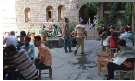
Resim 2. Dicle ve Fırat Kültür Merkezi avlusunda toplumsal cinsiyetin mekân ve zaman paylaşımı (Diyarbakır, 2009).

Yakındoğu'nun birçok şehrinde sınırlı bir işleve sahip kahve dükkânlarından daha farklı ve gösterişli olan kahvehanelerin İstanbul ve Anadolu'nun farklı şehirlerinde var olduğu bilinmektedir. Anadolu'nun mistik bir bölgesinde yer alan Diyarbakır, eski kahvehanelerinde üstü hasırlarla örülmüş kürsüler (tahta oturak) yapının önüne bırakılarak, açık havada gelip geçeni seyretmek, sohbet ortamı yaratmak ve nargile içenlere dinlenme olanağı sunulabiliyordu. Eski kahvehaneler özel alan ile kamusal alan arasında işlevsel veya kılışsal sonuçlara önsel olarak atıfta bulunulmayan erkeklere özgü mekân örnekleridir. Günümüz kent yaşamında ise, kamusal sosyal mekân kavramının erkeklerle; özel kavramın da kadınlarla özdeşleştirilmeyeceği bir görünüm sergilemektedir (Resim 2).