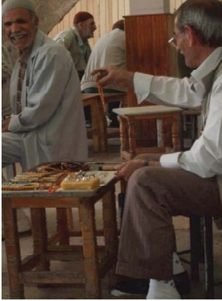
Resim 9. Ulucami kahvehanesinde oturan müdavimler ile tespih satıcısı (Diyarbakır, 2009).

Ortaya çıkan ilk kahvehane mekânları küçük ve izbe yerler olarak bilinir. Zaman içinde kahveye olan ilgi arttıkça, yerleşim alanlarında kahvehaneler çeşitlenerek toplumsal statülerine göre yeni isimlerle ortaya çıkmışlardır. Mahalle arası kahvehanelerine; çarşı, cami yanı kahvehaneleri (Resim 9) ile yol kahvehaneleri eklenmiştir. Toplumsal yapı dönüşümüyle birlikte şehir kahvehanelerinde fikir, siyaset ve edebiyat içerikli sosyal faaliyet alanları ortaya çıkmaya başlamıştır. Büyük bir sembolik değer taşıdığı için kahvehane mekânın başlangıçta camilerin ya-