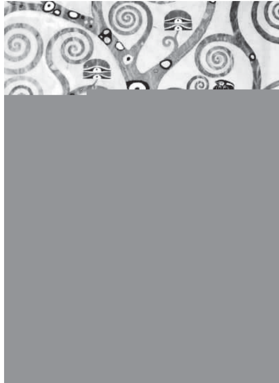
Resim 43 Haşhaş Ağacı, Gümüş Klimt

Fie ve ipekle Maia Bee'yi örneği (1916) Klimt emfi kafe, ekle elezik, ipekle akelele oğlak, bi kom ozis, aamş eme o e eleği, Ulaa a ağı meşi, ipekle sembolik esime fae emiş. Aka