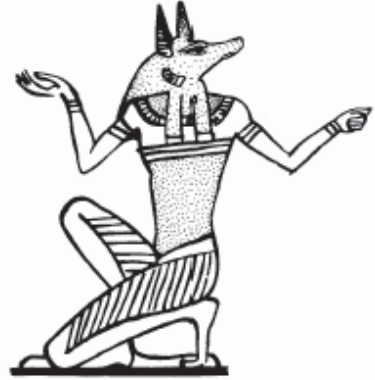
Şekil 14 akal başl A bis