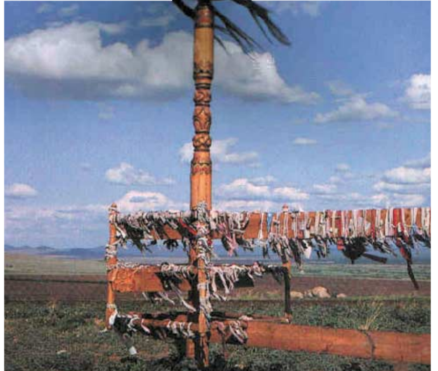
Şaman ayini sırasında dikilen kutsal direklere, ruhlara dilek dilemek amacıyla adak olarak çaput bağlanır. Benzer biçimde şaman ağacı, ya da dilek ağacı da denen ağaçlara çaput bağlanmasına ülkemizde de rastlanır.

Bu demir sopaya hastanın içindeki kötü ruhları kovan on sekiz kadar demir çingirak bağlanır. Ayrıca, kaminin habercilerini temsil eden iki