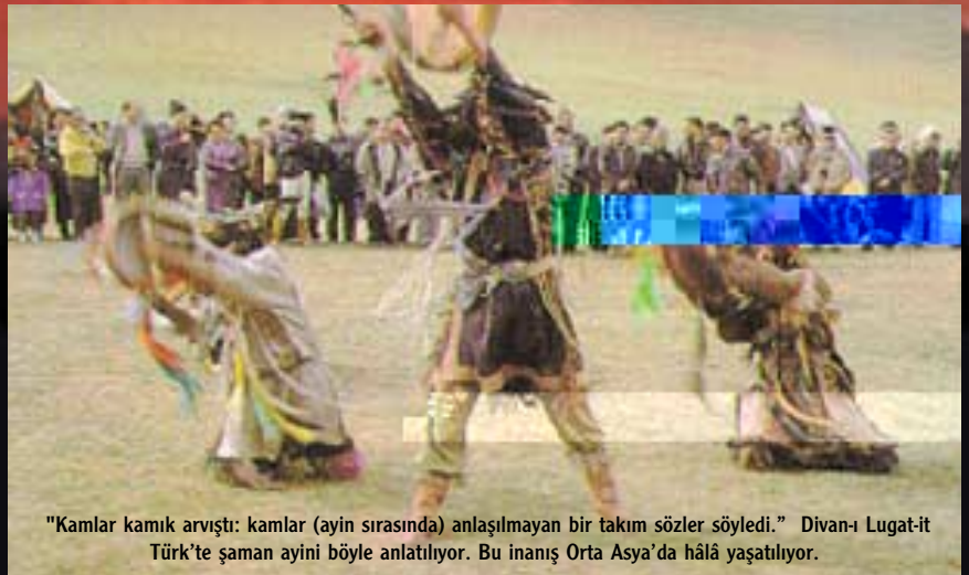
"Kamlar kamık arvıştı: kamlar (ayin sırasında) anlaşılmayan bir takım sözler söyledi." Divanı Lügat-it Türk'te şaman ayini böyle anlatılıyor. Bu inanış Orta Asya'da hâlâ yaşatılıyor.

Kaşgarlı Mahmut'tan öğrendiğimize göre kamlar, Müslüman Türkler zamanında da unutulmuş değil. Divanı Lügat-it Türk'te "Kamlar kamık arvıştı: kamlar (ayin sırasında) anlaşılmayan bir takım sözler söyledi." gibi cümlelere