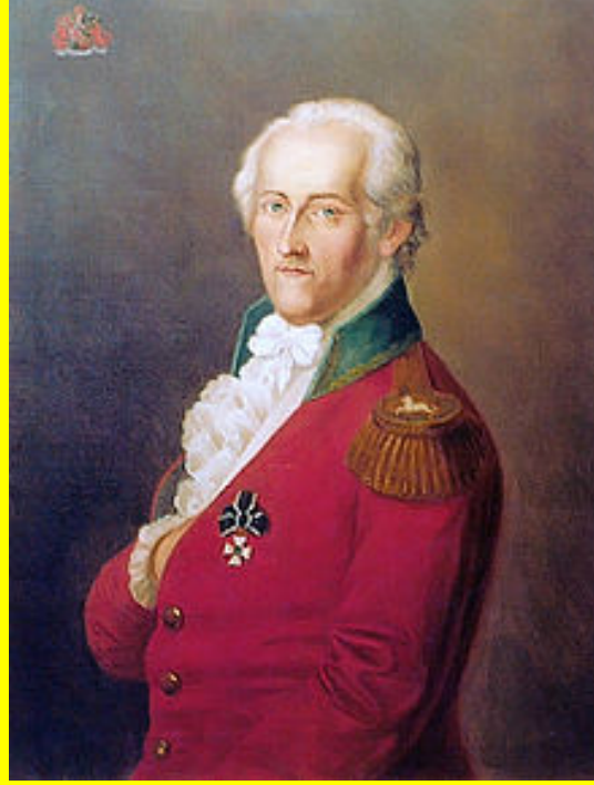
Adolph Freiherr Knigge