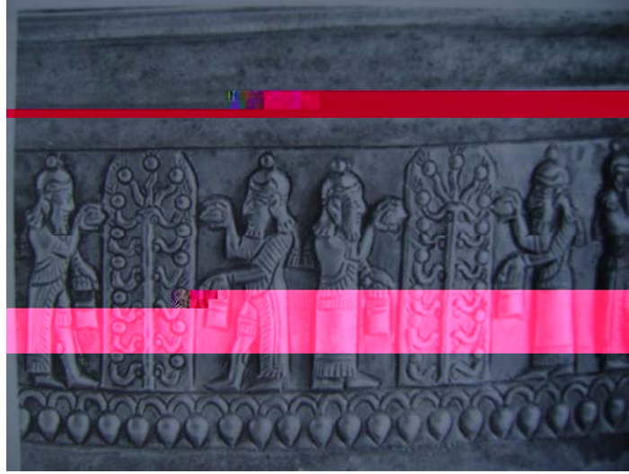
Urartu dönemi bakracından detay: Hayat Ağacı 12

Nart Sosriko doğmadan kâhinler bir kehanette bulunmuşlardır. Anlatıcılara göre Nart Sosriko'nun doğmasıyla birlikte Yer n n a ğ ı e i eceklerin adı kaybolacaktır. Yani kıtlık dönemleri baş gösterecektir.