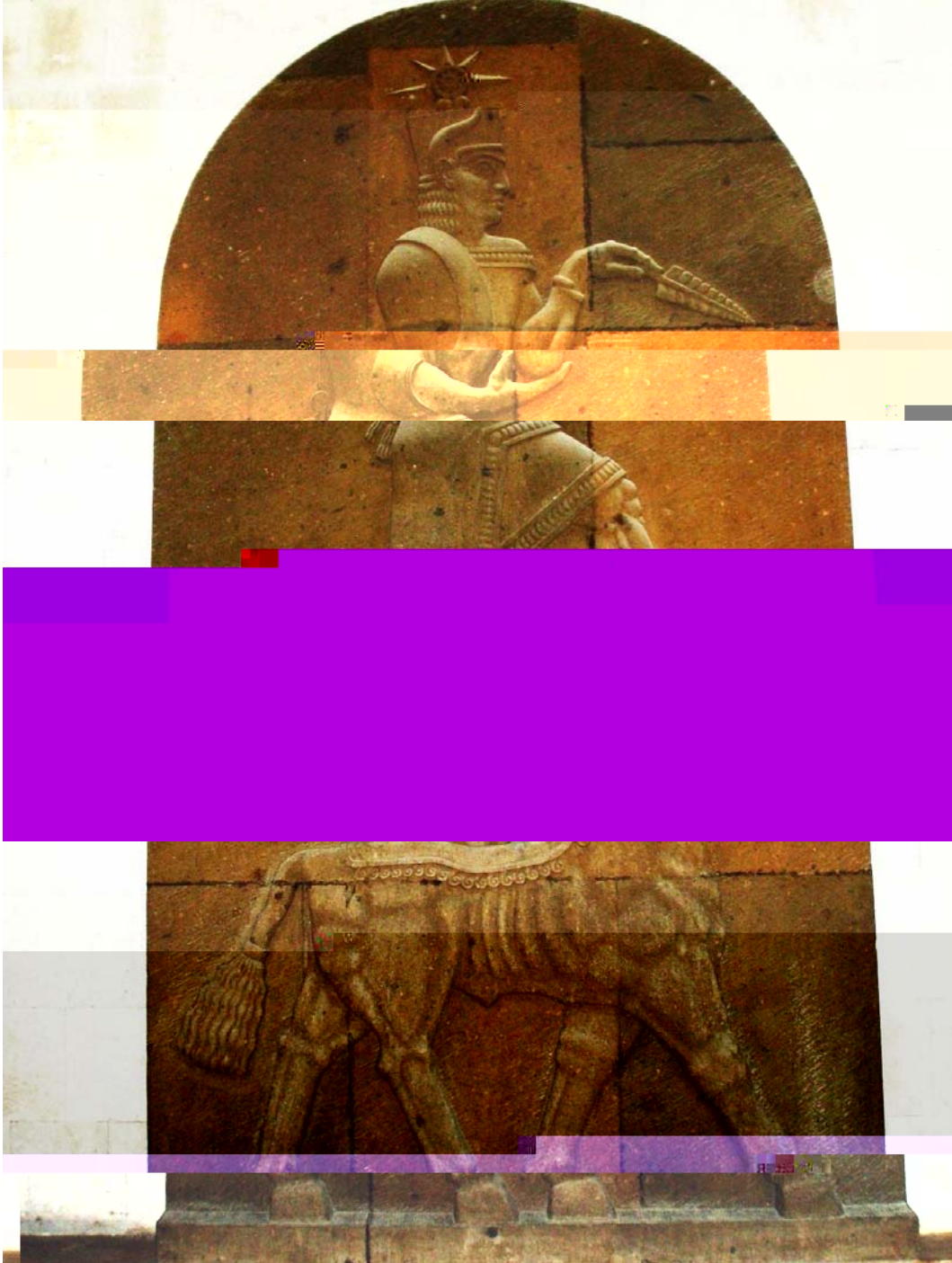
Urartu-Hatti Tanrısı Teişeba-Teşup

Yine de Nart Sosriko'nun Fırtına tanrısı Teişeba-Teşup ile olan benzerliği Nart mitolojisindeki diğer karakterler ile Anadolu ve Mezopotamya'nın pagan tanrıları arasında yapılacak yeni tematik okumaların önünü açmaktadır.