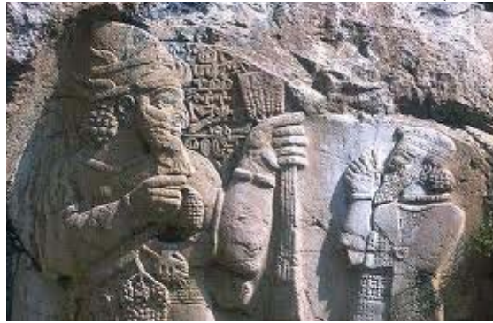
Hatti-Hitit bereket tanrısı Tarhundaş'a Nart mitolojisindeki Nart Thağalec gibi üzüm tohumları ve buğday başakları ile birlikte gösterilmektedir.